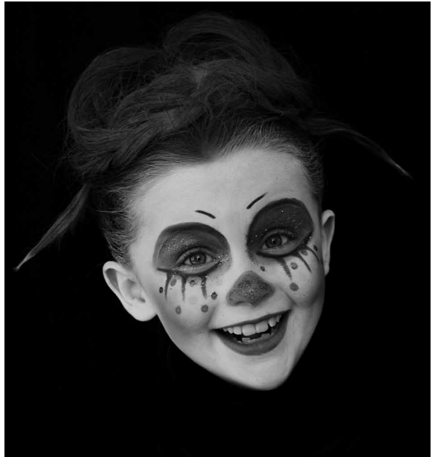
La Theaterschoul montre ce qu'elle sait faire avec « Clowns et sorcières » - les photographies de maquillage de Natalia Sanchez sont au Musée d'histoire(s) à Diekirch jusqu'au 6 septembre.