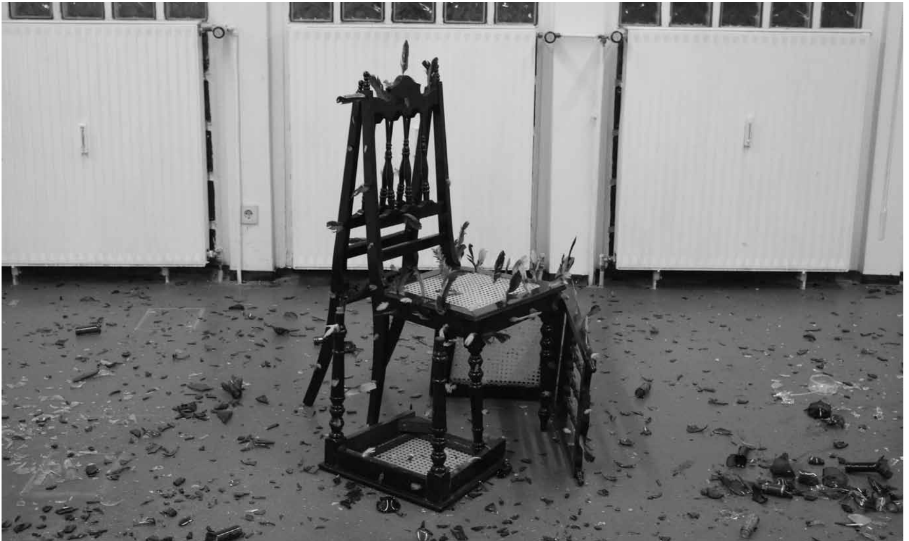
Kunst im Zeichen des Klimawandels: „Requiem für die Tropen“ von Francisco Klinger Carvalho im Kunstverein Junge Kunst in Trier - vom 24. August bis zum 14. September.