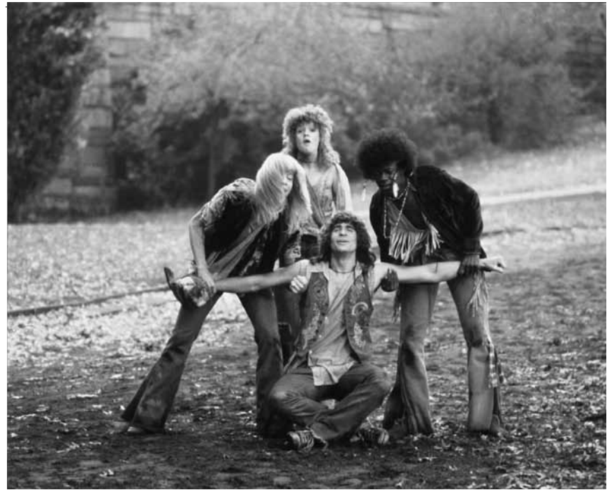
Auch in den Rotondes ist die Flower-Power ausgebrochen: „Hair“ - am 20. August.

Mitten in der Zeit von Flower Power und der ersten Friedensbewegung wird der junge Claude einberufen und soll aus dem ländlichen und Oklahoma in den Vietnamkrieg ziehen. In New York City, wo er sich der Musterung unterziehen soll, trifft er auf eine Gruppe von Hippies, deren Lebensart ihn sofort fasziniert.