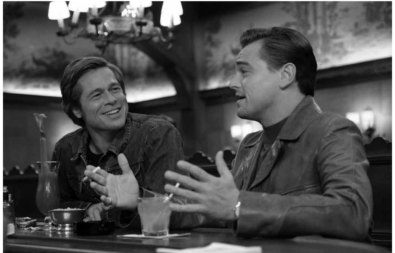
Es wird meta! Und auch irgendwas mit Charles Manson: „Once Upon a Time in Hollywood“ der neue Tarantino kommt in fast alle Säle.