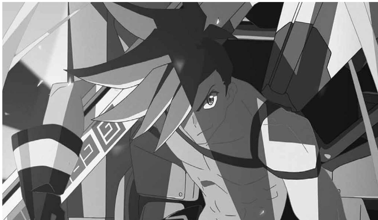
Flammenschwingende Mutanten und die angemessene Feuerwehr gibt es in „Promare“ - neu im Kinepolis Kirchberg.

Kaum verlassen die Menschen früh morgens ihr Zuhause, geht es in ihren Wohnungen auch schon drunter und drüber, denn dann haben ihre tierischen Mitbewohner sturmfrei. Hund Max und seine Kumpanen haben allerdings nicht nur Spaß,