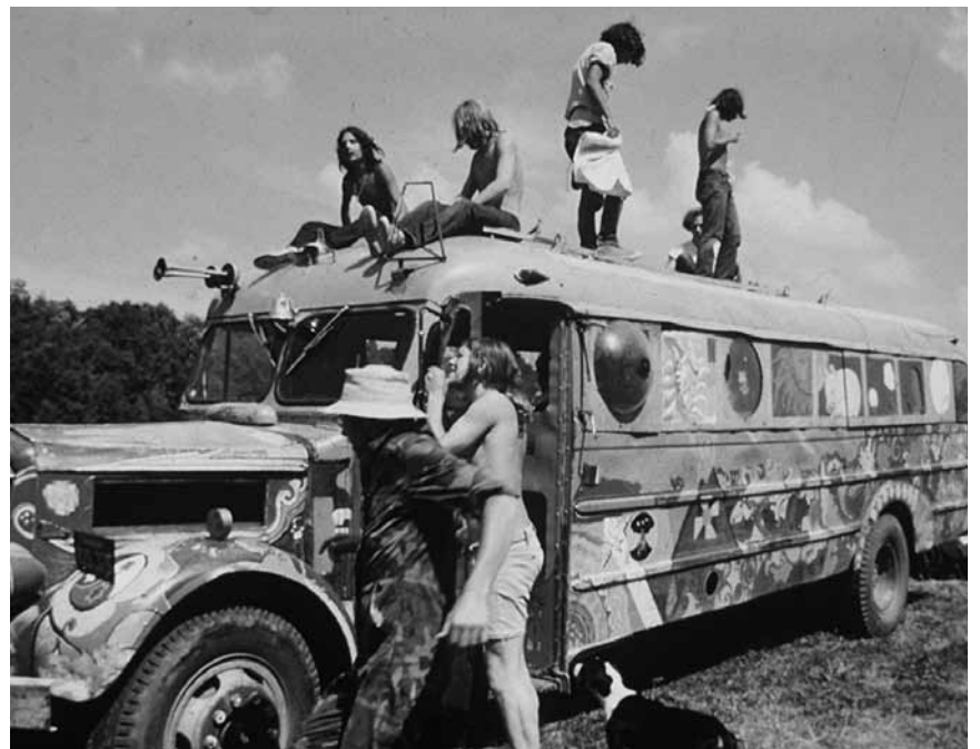
Hippie-Feeling auch noch 50 Jahre nach „Woodstock“ - der Dokumentarfilm von Michael Wadleigh läuft am 16. August im Waasserhaus.