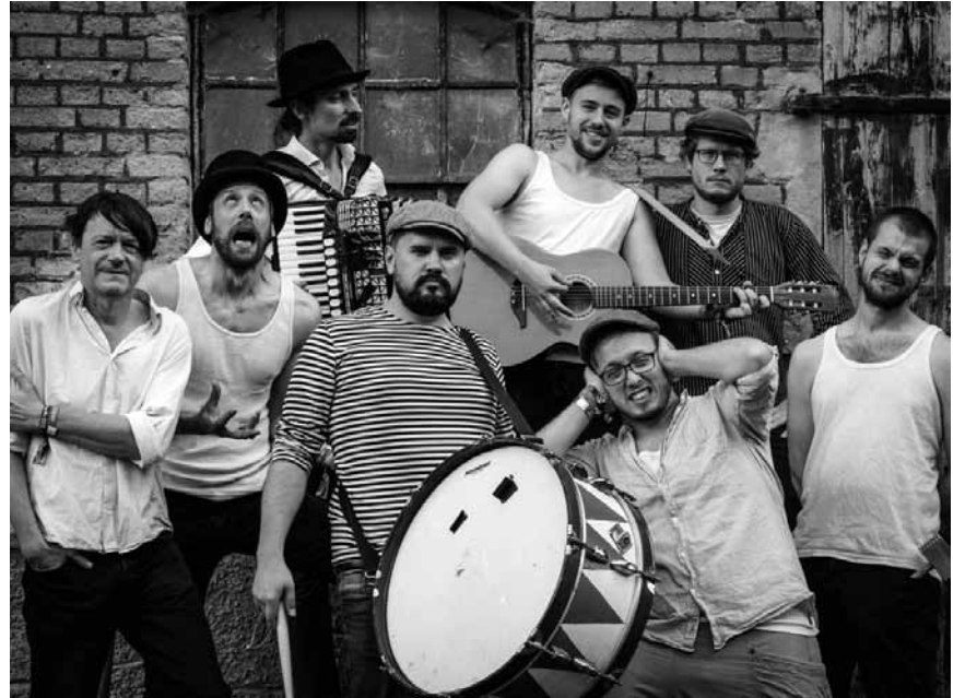
Die Tuchfabrik Trier lässt es krachen: Ivan Ivanovich & The Kreml Krauts kommen zum Ethnomusikfestival Creole Summer an diesem Freitag, dem 16. August.