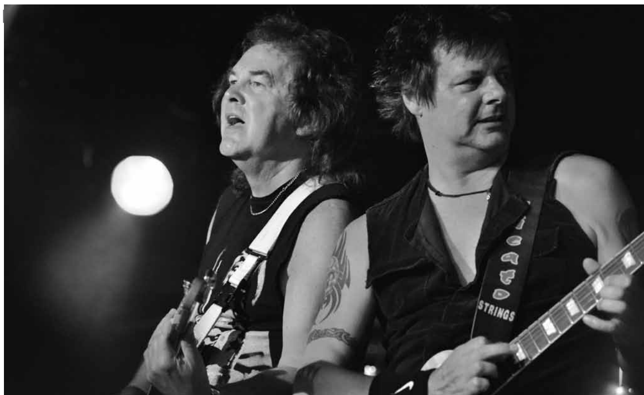
Les légendes qui ont cofondé le trash métal : Oliver/Dawson Saxon seront au Spirit of 66 à Verviers ce dimanche le 17 août.

Festival international de verre , atelier d'art du verre, Asselborn, 10h - 18h. Tél. 99 74 58. www.art-glass-verre.com