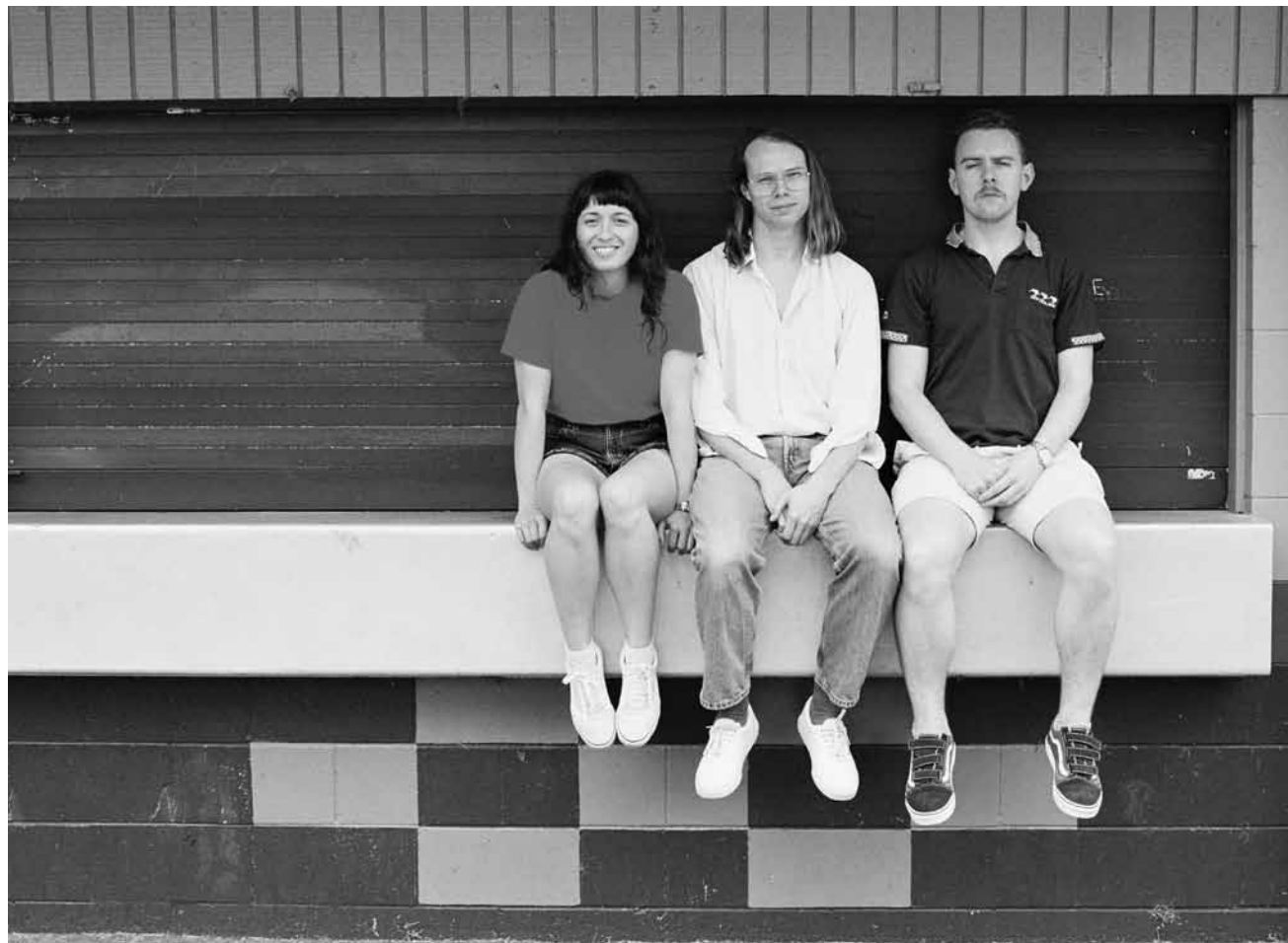
Rock it like it's 1990 ! The Beths sont un trio néozélandais faisant revivre l'indé-rock à l'ancienne - aux Rotondes le 21 août.