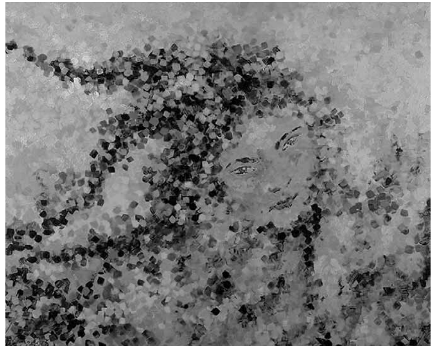
Blaue Mosaikpinselstriche, die ihre Inspiration am Meeresgrund finden: Die „Erscheinungen“ von Anna Wode sind bis zum 8. Dezember im Trifolion zu sehen.