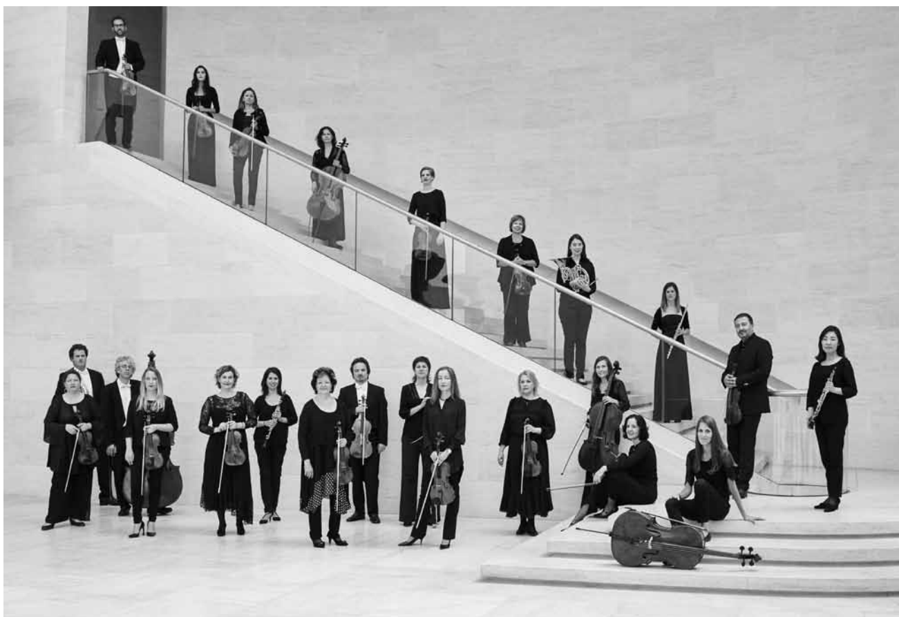
Ils se préparent aussi pour le Brexit musical : le 17 novembre, l'Orchestre de chambre du Luxembourg jouera son programme « Crossing Europe - Visiting Great Britain » à la Philharmonie.

Younik , vintage market, Rotondes, Luxembourg , 11h - 19h. Tél. 26 62 20 07. www.rotondes.lu