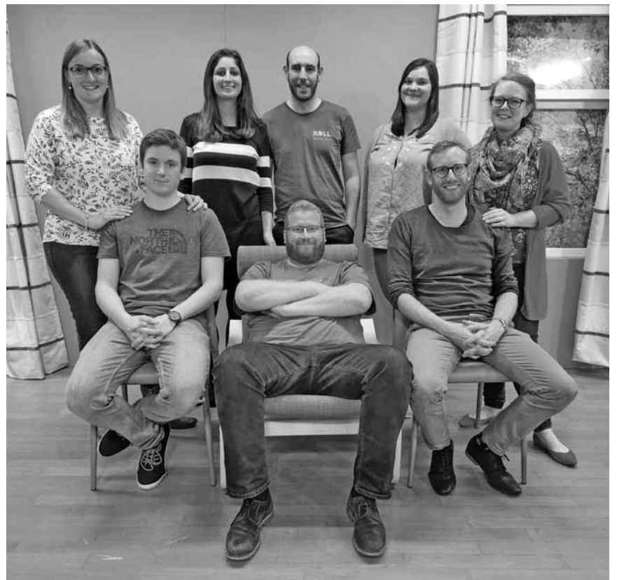
„De Bopa léisst et kraachen“ zu Éiter - de Spektakel mam Club des jeunes kënn dëse Samschdeg, den 9. an dëse Sonndeg, den 10. November an de Centre culturel.