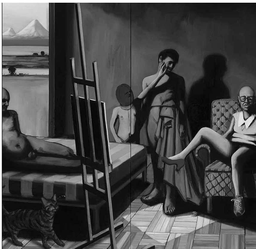
Une vision féminine du monde : « Female Gaze », exposition collective organisée par Artscape Contemporary Art et montrée à la Foundry à Luxembourg, jusqu'au 9 février 2020.