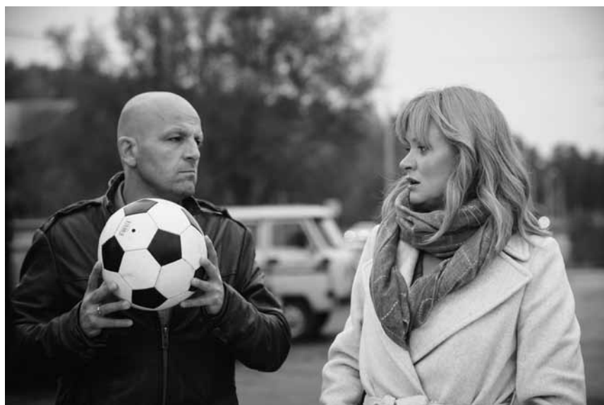
A not so feminist plot: In "Davay razvedemysya (Another Woman)" a doctor, wife and mother doesn't shy back from going supernatural to cling on her husband - who's about to leave her for a younger woman. At the Kinopolis Kirchberg on this Sunday, December 15th.