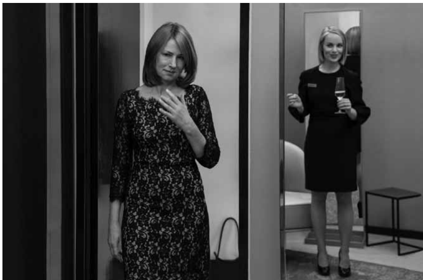
Wenn eine lebenslange Obsession endlich Früchte trägt und man nicht eingeladen ist: „Lara“ - neu im Scala.

und Spencer ist verschwunden. Gemeinsam entscheiden sich die Freunde dafür, die gefährliche Welt von Jumanji erneut zu betreten, um ihren verschollenen Kumpel zu retten.