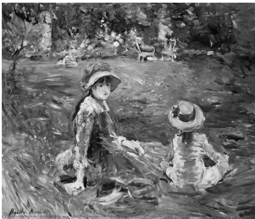
Girl Museum: Impressionist Girls