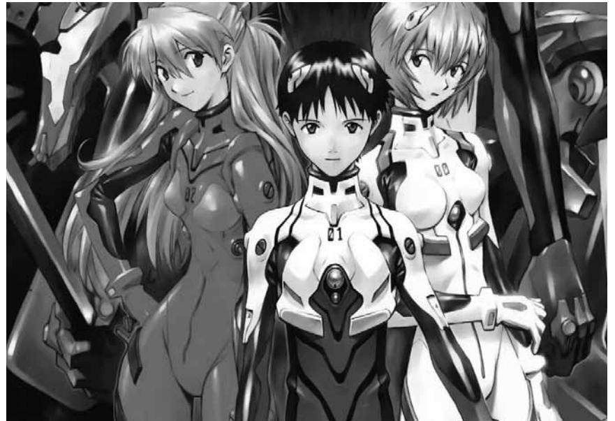
Ein Manga mit weltweitem Kultstatus: „Neon Genesis Evangelion“ - zum Binge-Watchen auf Netflix empfohlen.

Seit 19 Jahren sitzt Daniel Holden in Einzelhaft. Er wurde wegen der Vergewaltigung und Ermordung von Hanna Dean zur Todesstrafe verurteilt. Eines Tages aber wird er aufgrund der Resultate neuer DNA-Teste freigesprochen. Im Gefängnis konnte Daniel nur mithilfe von Büchern mit der Außenwelt in Kontakt treten; nun muss er wieder lernen, mit anderen zu interagieren und zu kommunizieren. ■■■■ Daniels Erfahrungen, die Art und Weise, wie er sein Umfeld und vor allem sich selbst neu kennenlernt, werden mit großer Zärtlichkeit und teils wunderschönen Bildern dargestellt. Immer wieder