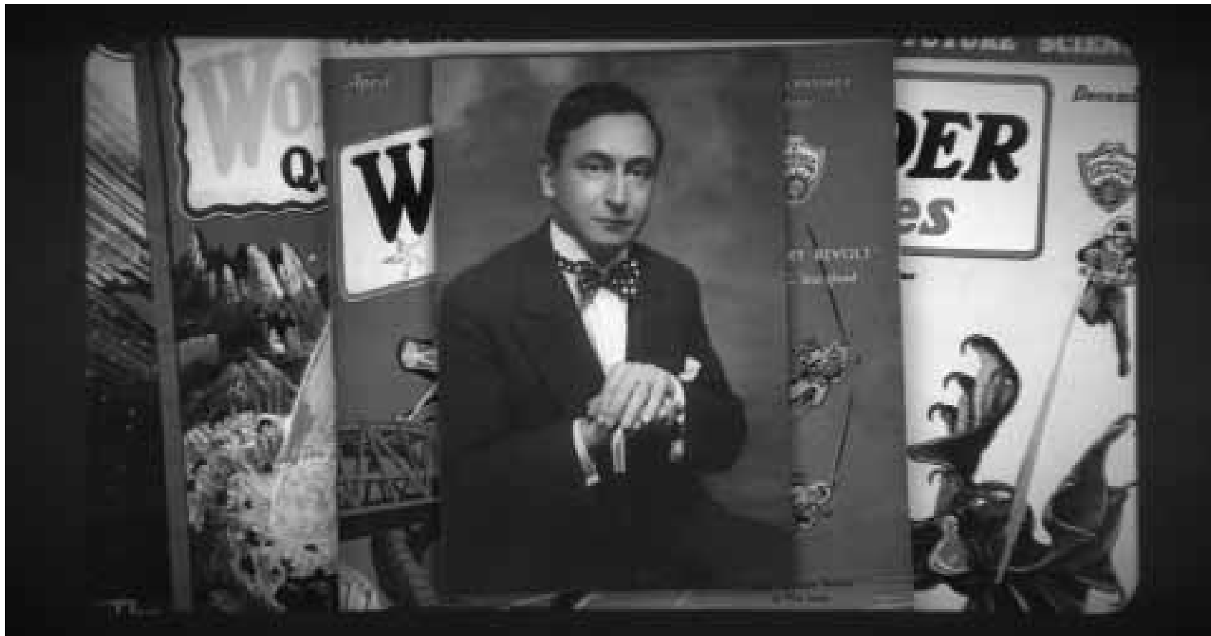
Hugo Gernsback, l'éditeur d'« Amazing Stories »... mais pas seulement.