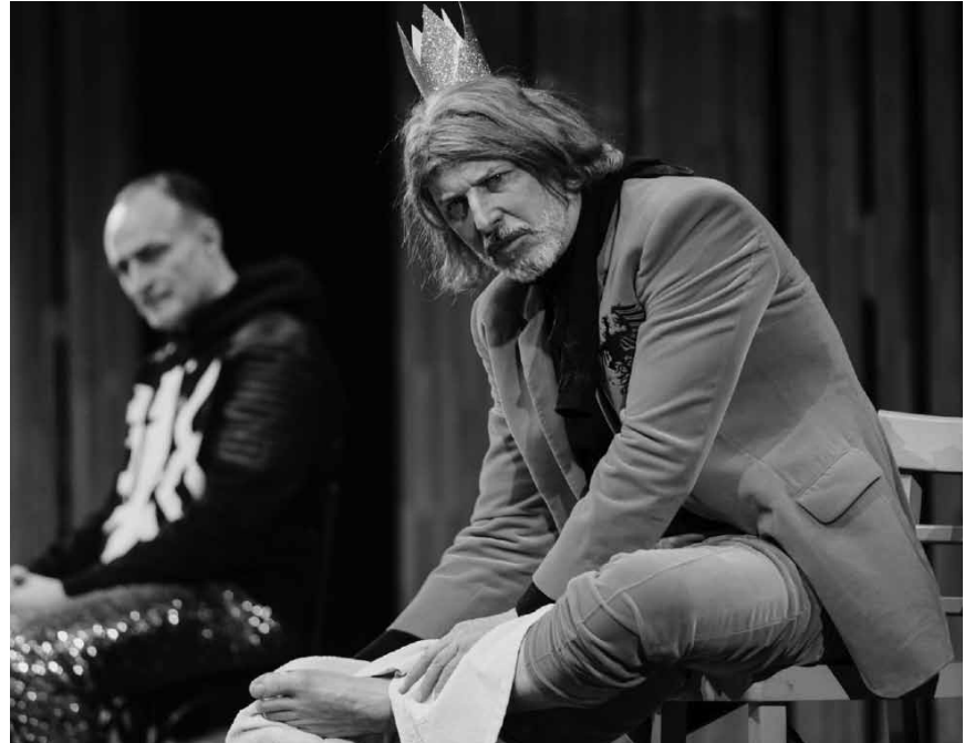
Als die Österreicher*innen ihrem König davonliefen: „König Ottokars Glück und Ende“ von Franz Grillparzer gibt es an diesem Freitag, dem 10. April aus dem Volkstheater Wien.