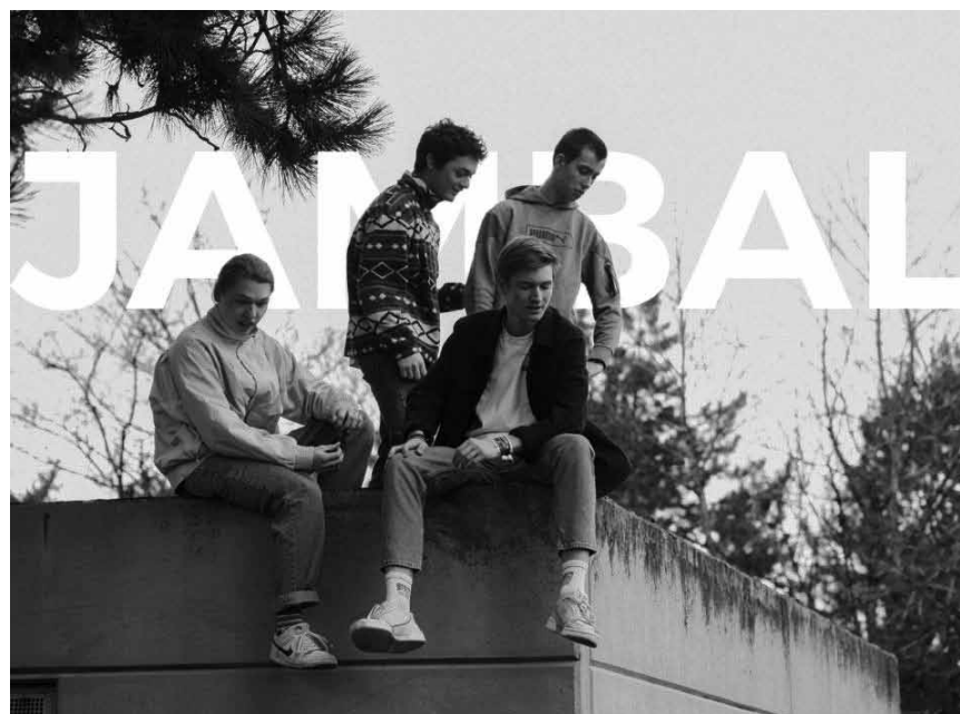
La « Crazy Quarantine » continue son cirque jazzy avec le concert de Jambal, ce vendredi 24 avril...

Hoplalum Live , e Livestream fir Kanner, Figurentheaterhaus Poppespännchen, 16h. www.facebook.com/Poppespennchen