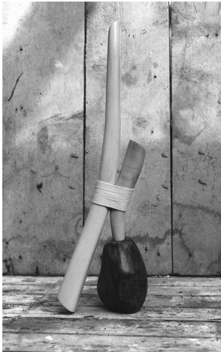
La galerie Simoncini rend hommage à Willem Bouter avec des sculptures – jusqu'au 30 juin.

installation, Centre Pompidou-Metz (1 parvis des Droits-de-l'Homme.