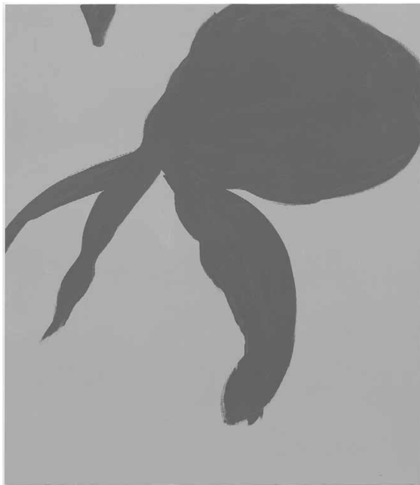
La galerie Nosbaum Reding montre des peintures de Helmut Dörner jusqu'au 5 septembre.