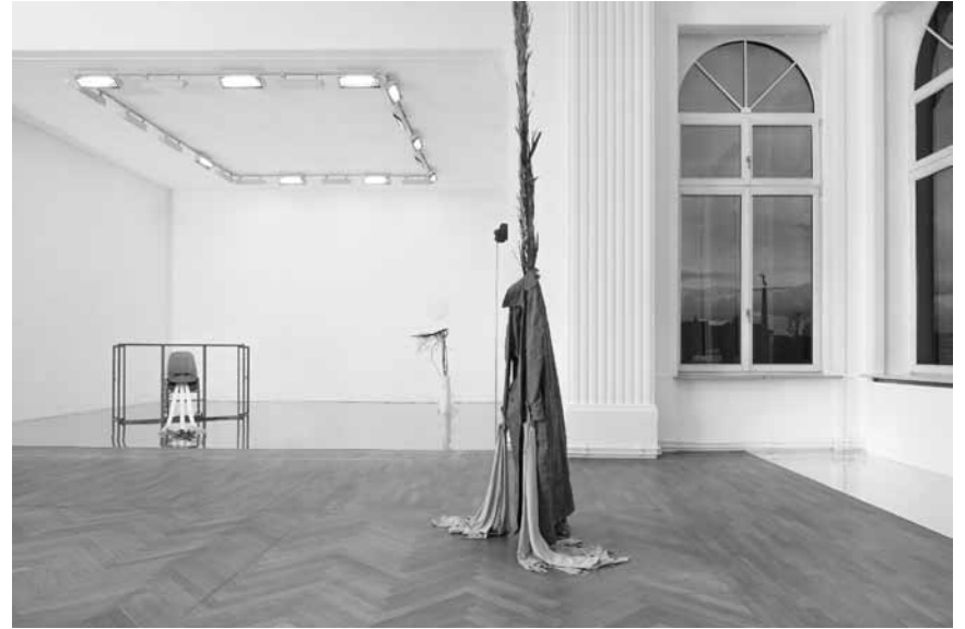
Sophie Jungs Kunstwerke sind im historischen Ballsaal und im Theater des ehemaligen Spielcasinos im Herzen von Luxemburg-Stadt ausgestellt.