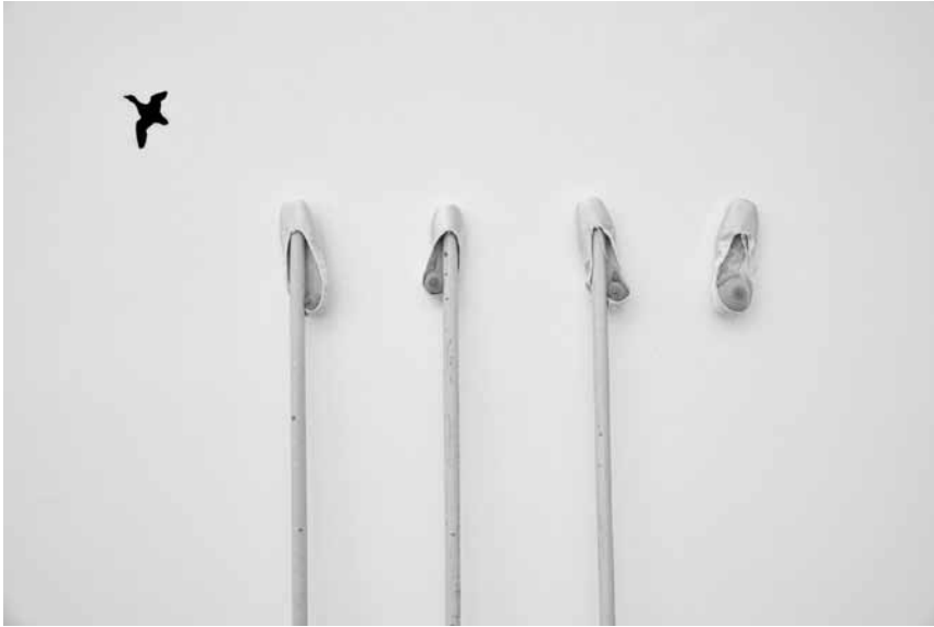
Kunstwerk mit „Pointe“.