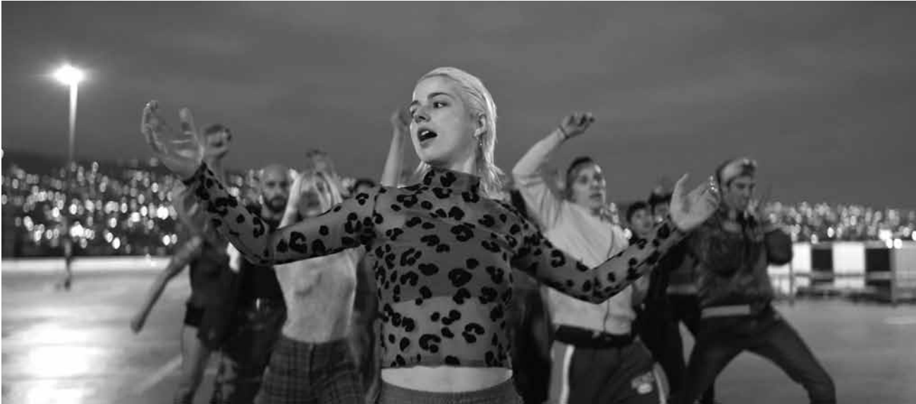
Ema danse sa vie avec un temps d'avance, sans entraves.