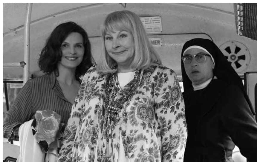
« La bonne épouse » et le vent de liberté post-1968 – à voir dans presque tous les cinémas au Luxembourg.

Großbritannien im 19. Jahrhundert: Dr. Dolittle war einst ein berühmter Arzt und Veterinär. Doch als er seine Frau vor sieben Jahren verlor, zog er sich komplett zurück. Wie ein Einsiedler lebt er nun hinter den hohen Mauern seines Anwesens. Als die junge Königin Victoria schwer krank wird, bleibt Dolittle nichts anderes übrig: Er muss hinaus in die weite Welt, um das Heilmittel zu finden. Doch dafür muss er ausgerechnet jene mysteriöse Insel