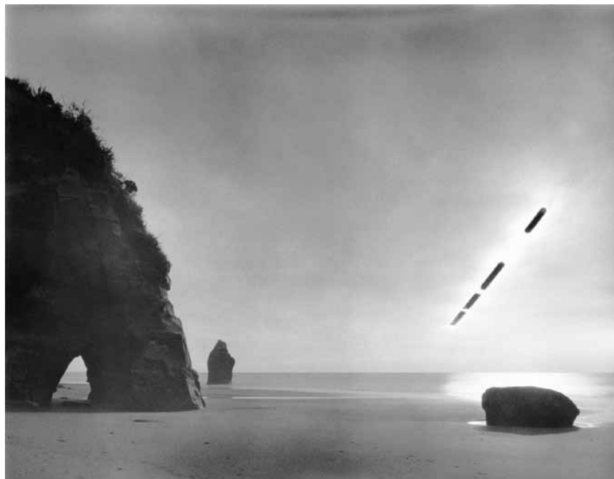
« 1h », expo de photographies de Hans-Christian Schink, est à voir aussi longtemps que vous voulez au Schlassgaart de Clervaux, mais avant le 26 mars 2021.

The Family of Man (montée du Château. Tél. 92 96 57), Clervaux, me. - di. + jours fériés 12h - 18h.