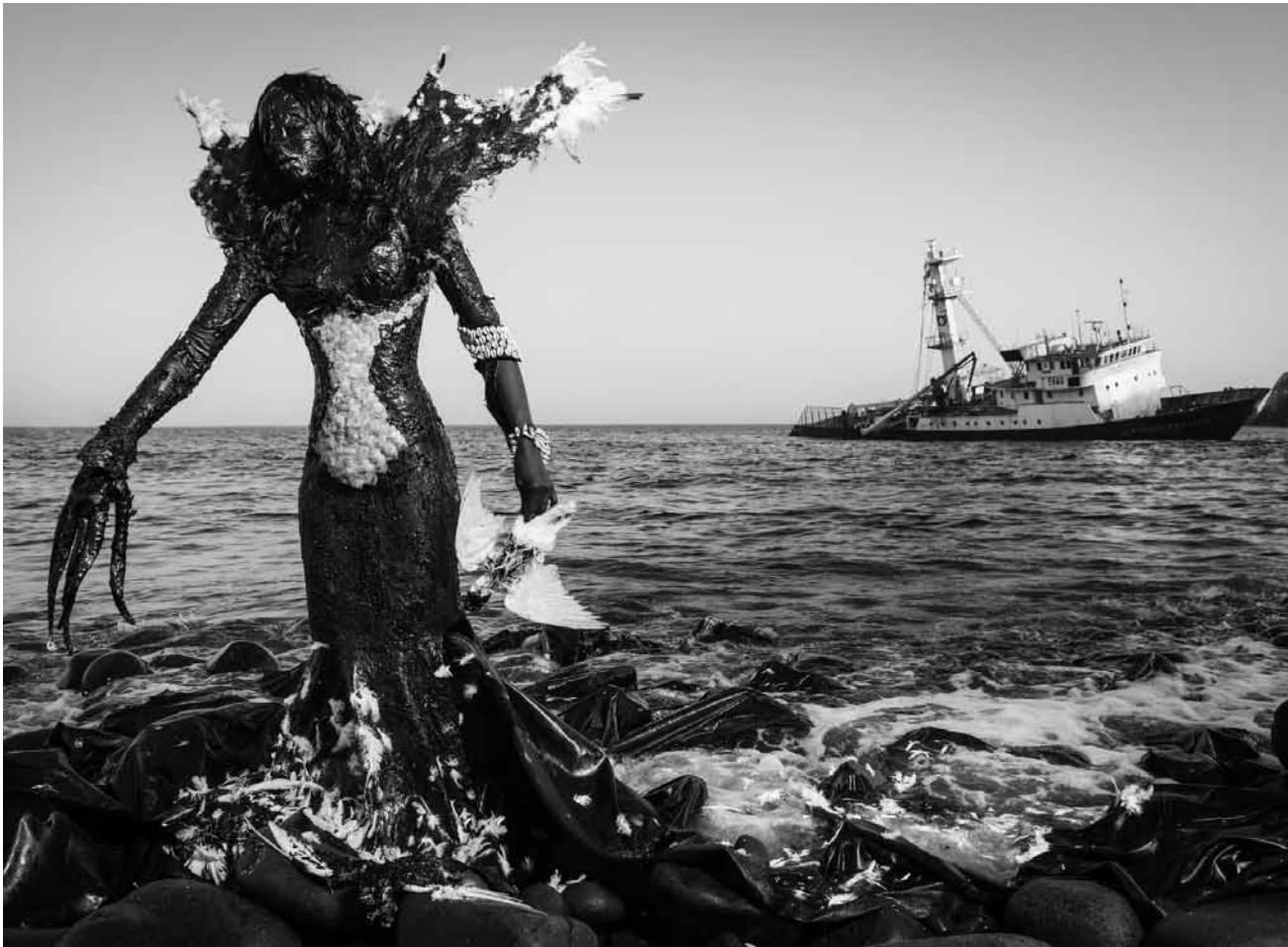
Nein, es geht in der Völklinger Hütte nicht um Seemonster, sondern um „Afrika - Im Blick der Fotografen“ - noch bis zum 1. November.

bis zum 9.8., Di. - Fr. 10h - 13h + 14h - 17h, Sa. + So. 14 - 17h.