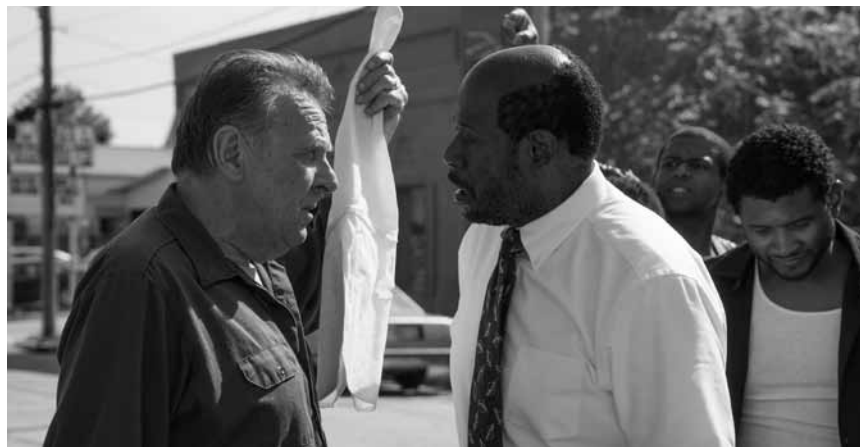
„Burden“, oder wie eine schwarze Kirchengemeinde ein Ex-Mitglied des Klu-Kux-Klans das Lieben lehrt - zu sehen im Kinopolis Kirchberg.

Nachdem sich Königin Elsa nicht nur ihren Ängsten, sondern auch der Öffentlichkeit stellte, kehrte in Arendelle endlich Ruhe ein. Doch die währt nicht lange. Als Elsa eines Tages meint eine geheimnisvolle Stimme aus dem Wald rufen zu hören, verspürt sie einen unbändigen Drang, dieser nachzugehen, in der Hoffnung, Antworten auf Fragen zu finden, die ihr nach wie vor Rätsel aufgeben.