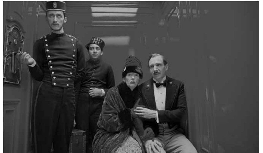
Von wegen „Vakanz doheim“: Die regionalen Säle laden ins „The Grand Budapest Hotel“ ein - Gutscheine vom Tourismusministerium nicht vergessen!

Geppetto vient de terminer sa dernière œuvre : une marionnette en bois. À sa grande surprise, celle-ci s'anime, commence à parler, courir et manger. N'ayant jamais eu d'enfants, Geppetto l'appelle Pinocchio et décide de l'élever comme son fils. Mais Pinocchio se révèle être assez turbulent vivra de nombreuses mésaventures, entraînant parfois Geppetto avec lui. Pinocchio sera trompé, kidnappé et poursuivi par des bandits à travers un monde