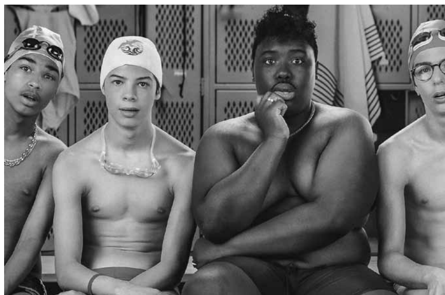
Jeunes célibataires en formation au Kinepolis Kirchberg : „T'as pécho ?“ parle d'ados à la recherche de l'amour.

Undine ist eine Historikerin, die in Berlin lebt und als Stadtführerin arbeitet. Nach außen hin erscheint ihr Leben unspektakulär, dabei ahnt niemand, dass sie ein großes Geheimnis mit sich herumträgt. Erst als ihr Freund sie für eine andere Frau verlässt, holt sie ein Fluch ein: Als Sagenfigur und Meerjungfrau müsste Undine ihn nun streng genommen töten und ins Wasser zurückkehren, aus dem sie einst gekommen ist.