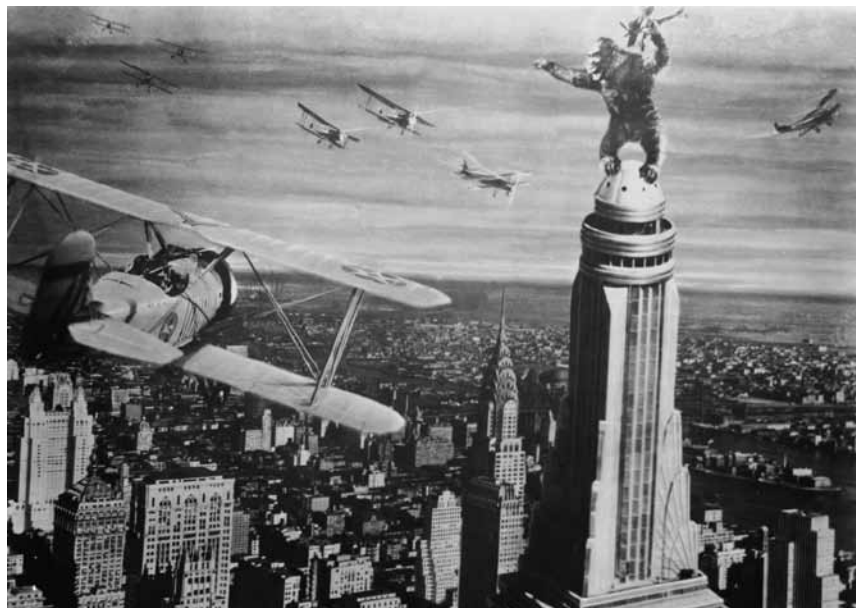
Attention, il faut éviter de prendre l'avion le 4 août vers 20h30 : « King Kong » est à l'œuvre à la Cinémathèque !

Ein Sturm trägt die kleine Dorothy Gayle in das magische Land Oz. Verzweifelt macht sie sich auf den Weg in die Hauptstadt, wo der große Zauberer von Oz lebt - nur er kann ihre Rückkehr nach Hause ermöglichen. Der Weg dorthin wird zu einer Reise voller Gefahren und Abenteuer, doch findet Dorothy schnell neue Freunde und Verbündete: eine Vogelscheuche, die sich Verstand wünscht, ein Mann aus Blech, der gerne ein Herz hätte, und einen furchtsamen Löwen, der unbedingt mutiger sein möchte.