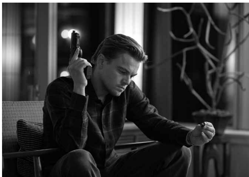
Bereit mit Leonardo Di Caprio um die Wette zu träumen? „Inception“ läuft an diesem Freitag, dem 31. Juli, um 22h, im Open Air Mondorf.