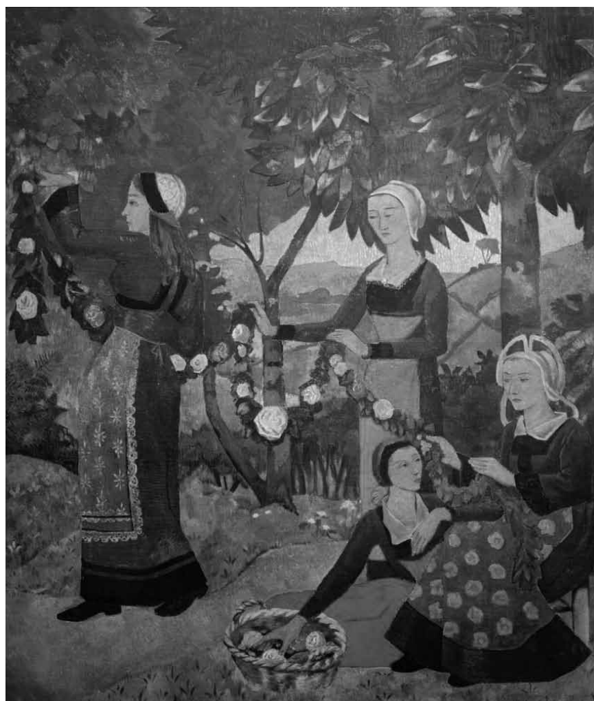
« Folklore », au Centre Pompidou-Metz, est à voir jusqu'au 21 septembre.

Visites guidées les me. 19h (GB), sa. 11h (L), 15h (D), 16h (F), di. 11h (GB), 15h (D), 16h (F). Visite guidée supplémentaire le sa. 15.8 à 16h, inscription obligatoire. « Ask Me », médiateurs-trices disponibles les me. 17h - 21h, sa. + di. 10h - 18h. Visites guidées pour enfants ce ve. 7.8 (L), le me. 5.8 (F) à 15h (L) (> 6 ans), inscription obligatoire.