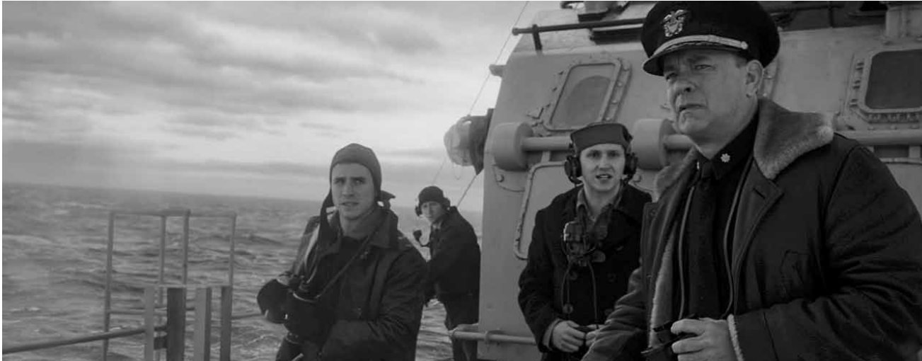
Un spectacle de guerre à l'américaine plein de pathétisme : « Greyhound ».