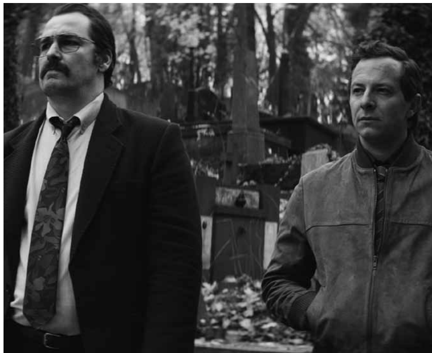
Sehen so die Bewohner eines freien Landes aus? Die Antwort gibt es im Kinepolis Belval und Kirchberg in „Freies Land“.