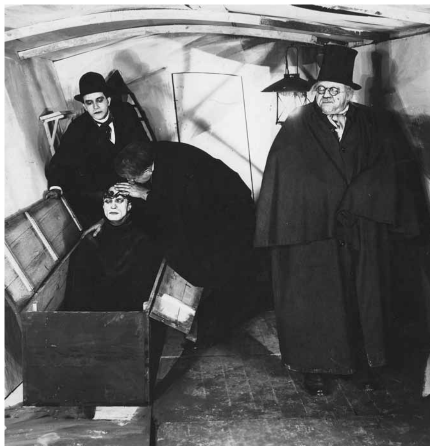
„Das Cabinet des Dr. Caligari“ läuft am 12. August in der Cinémathèque - wer traut sich?

Nachdem ihr Mann verstirbt, lebt die wohlhabende Witwe Cary Scott einsam und zurückgezogen in einer kleinen Stadt in der Provinz von Neu-England. Als sie eines Tages zufällig den Gärtner Ron kennenlernt, blüht die attraktive Frau zu neuem Leben auf. Zwischen den beiden entspinnt sich eine zarte Romanze. Doch es dauert nicht lange, bis hämische Gerüchte über das Liebespaar in der kleinen Gemeinde die Runde machen.