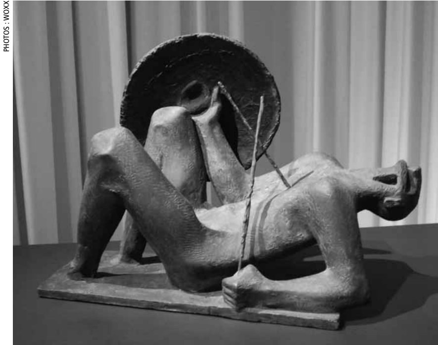
« Guerrier blessé », plâtre, 1956.