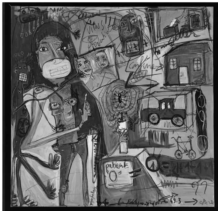
Fan de Basquiat et de Picasso, l'autodidacte Martine Coloos se lâche à la Castel Gallery à Luxembourg - à voir entre le 7 et le 27 septembre.

sculptures, Casino Luxembourg - Forum d'art contemporain (41, rue Notre-Dame. Tél. 22 50 45), jusqu'au 25.9, me. - lu. 11h - 18h.