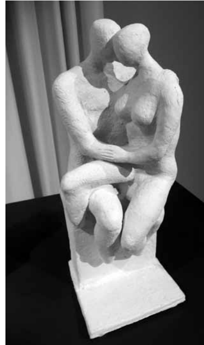
Sans titre, terre cuite.