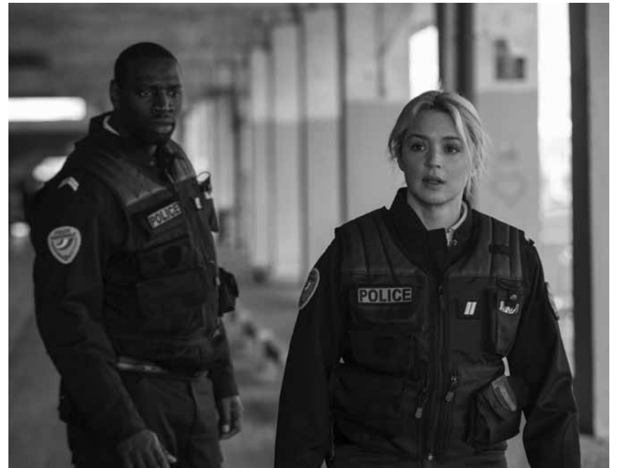
Dans « Police », le nouveau film d'Anne Fontaine, se pose un cas de conscience à trois flics : renvoyer un réfugié vers sa mort certaine est-il acceptable ou non ? Nouveau à l'Utopia.

Nachdem P. T. Barnum seine Arbeit verliert, treiben ihn und seine Frau Charity Existenzsorgen um. Doch dann hat der zweifache Vater eine Geschäftsidee: Er gründet ein Kuriositätenkabinett, für das er unter anderem eine bärtige Frau und einen kleinwüchsigen Mann anheuert. Doch er will seinen zahlenden Gästen nicht