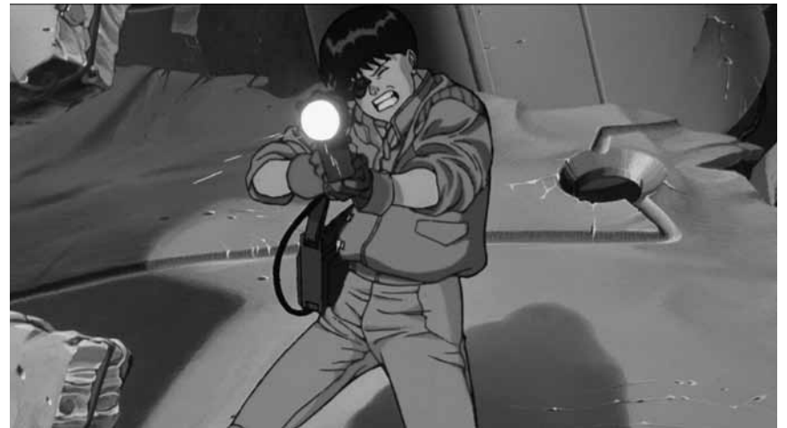
Ça sent bon la télé française des années 1980 : « Akira », manga de légende remasterisé en 4K, revient sur les écrans aux Kinopolis Belval et Kirchberg.

✘ « Black Panther » est une vraie machine à combattre les clichés : un superhéros noir venant d'un pays africain dont l'avancement technologique devance tout ce que nous connaissons et dont les généraux sont tous féminins. Cela dit, le film ne dépasse pas les clivages classiques du manichéisme hollywoodien - malgré quelques pointes d'humour inattendues. (lc)