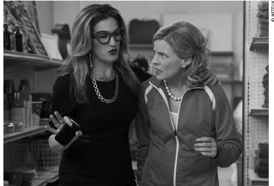
„Lady Dynamite“ mag auf den ersten Blick aussehen wie eine gewöhnliche Komödie, ist davon aber weit entfernt.