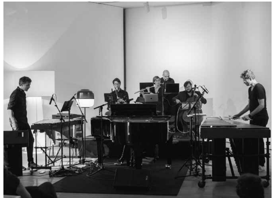
Die Victor-Kraus-Group verbindet sechs luxemburgische Musiker*innen um dem „Canto Ostinato“ von Simeon ten Holt neues Leben einzuhauchen - an diesem Sonntag, dem 6. September im Cube521 in Marnach.