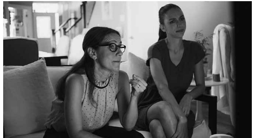
Le roman de Léa est-il si mauvais ? « Le bonheur des uns... » est un film sur l'amitié, l'écriture et la jalousie - à voir au Kinepolis Kirchberg.

Max ist 9 Jahre alt und kann sein Glück kaum fassen, als er sein neues Zuhause kennenlernt: Die Burg Gerold- seck ist zwar mittlerweile ein Alten- heim, wo seine Mutter als Altenpfle- gerin arbeitet, doch das Gemäuer war mal eine echte Ritterburg. Max schließt schnell neue Freundschaft mit den Senioren Vera, Horst und Kilian von Tisch Nummer 7, die nicht umsonst „die wilde 7“ genannt werden, denn sie haben es immer noch drauf. Als auf Burg Geroldseck plötzlich Wertge- genstände verschwinden, macht das