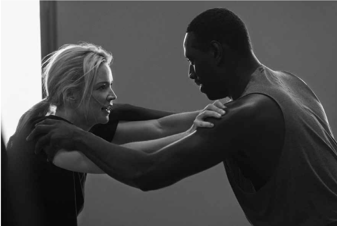
La lutte entre collègues est aussi mentale que physique.