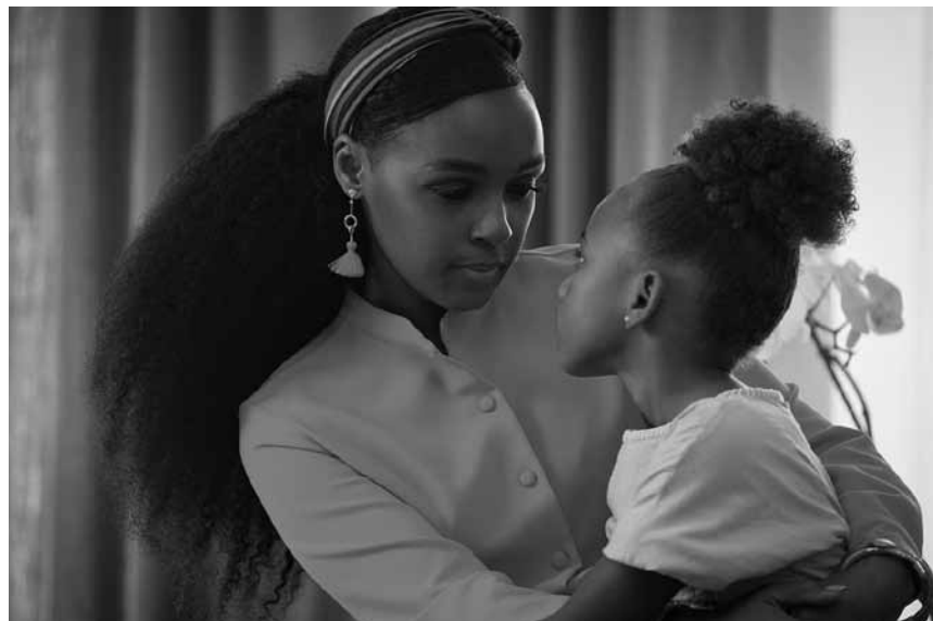
Auch in Parallelwelten gibt es Schmuck: „Antebellum“ erzählt von einer Bestsellerautorin auf Umwegen - zu sehen in fast allen Sälen.

Claire est une pianiste de renommée mondiale qui parcourt le monde, assistée par Frédéric, son mari agent coach couteau suisse. Tous deux ne vivent que pour la musique et sont en parfaite harmonie : ils ne veulent pas d'enfants. Tout change le jour où Frédéric assiste à une naissance surprise lors d'un vol Paris-New York.