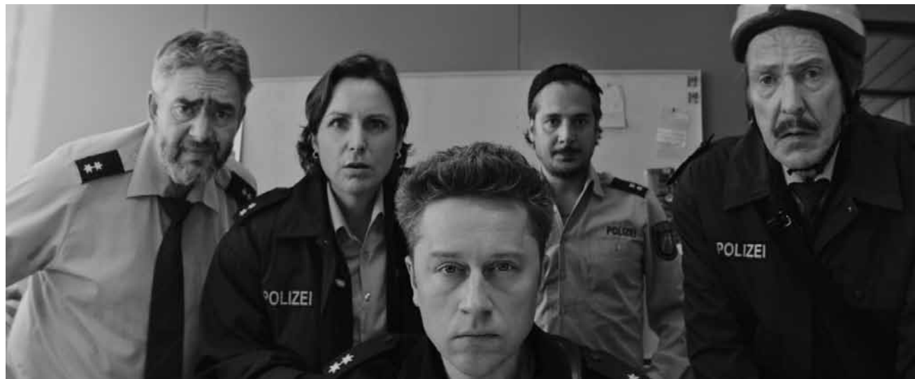
Wer ist hier überflüssig? „Faking Bullshit - Krimineller als die Polizei erlaubt!“ läuft im Kinopolis Belval und Kirchberg sowie im Scala.

tauschen und jeweils in das Leben des anderen einzutauchen.