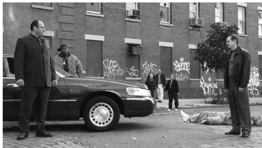
La vie quotidienne de Tony Soprano comprend souvent des macchabées allongés dans la rue...