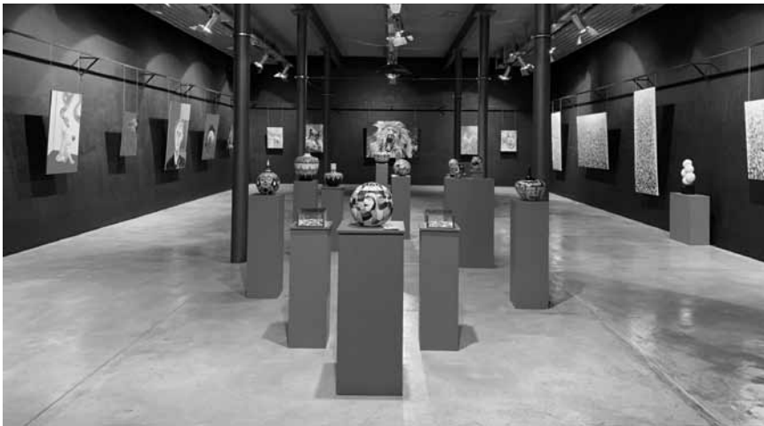
L'espace H2O fait étalage de ses artistes avec l'exposition « Les artistes résidents » - du 25 septembre au 11 octobre.