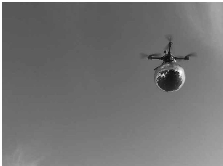
Night fever au centre d'art de Dudelange jusqu'au 18 octobre : Marianne Villière présente ses photographies dans « Mirage mirage ».