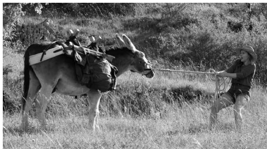
Dans « Antoinette dans les Cévennes », l'héroïne cherche son amant en compagnie de son ami poilu et têtue - à voir à l'Utopia.

Mina entdeckt eines Tages verwundert, dass sie die Gabe besitzt, in