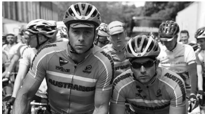
Das gelbe Trikot im Blick: „The Racer“, über Konkurrenzdruck und Doping im Radsport - am 26. September um 19h im Kinopolis Kirchberg.

Treffen sie den richtigen Ton? In „The High Note“ geht es um Ambitionen, die Musikszene und Star-Allüren - zu sehen an diesem Freitag, dem 18. September um 19h im Utopia.