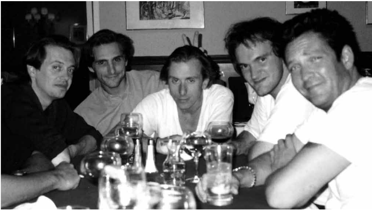
Der Meister höchstpersönlich auf der Kinoleinwand: In „QT8: The First Eight“ dokumentiert Tara Wood die acht ersten Werke Tarantinos und seine Karriere – läuft im Kinopolis Belval und Kirchberg sowie im Utopia.

Drogenkonsum drosseln sollte, einen Koffer mit geheimnisvollem goldglänzenden Inhalt und einen Boxer auf der Flucht.