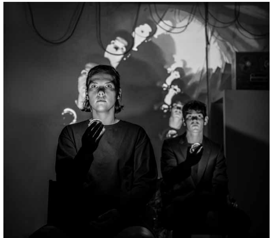
„Die Politiker“ betreten die Bühne vor ausverkauftem Saal - und zwar in der Sparte 4 in Saarbrücken, an diesem Samstag, dem 19. September um 20h.