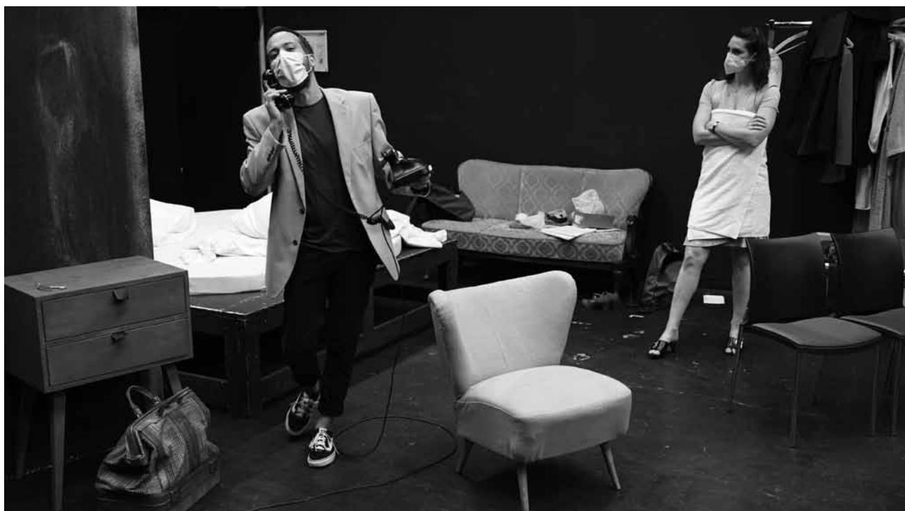
„Auf und davon“, aber bitte mit Maske: Fluchort ist das Theater Trier, am 26. September, ab 19h30.