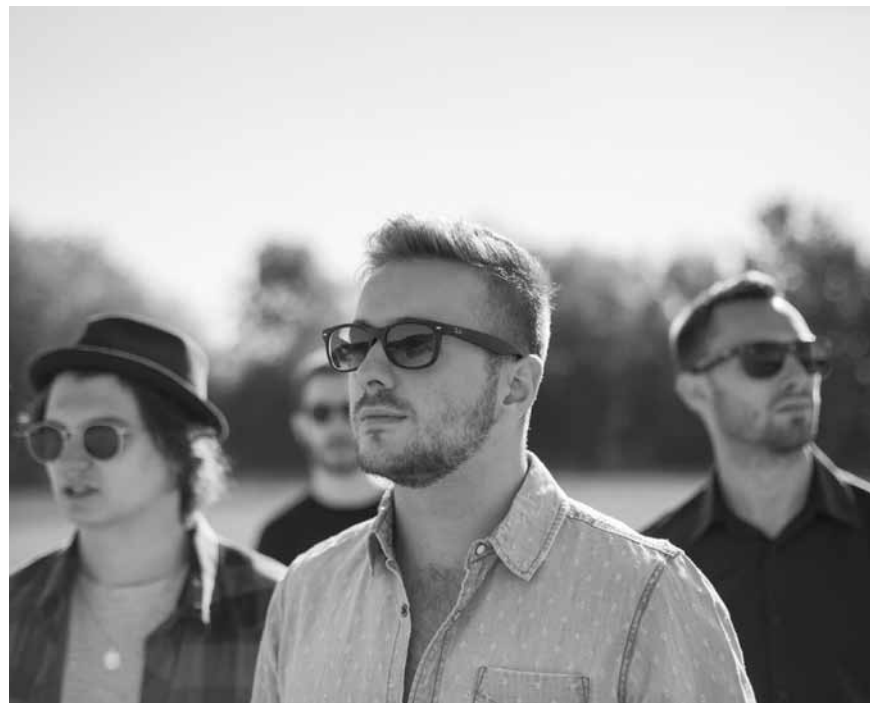
Zero Point Five treten an diesem Freitag, dem 25. September, um 20h im Aalt Stadhaus in Differdingen auf - melodioser Folkrock ist vorprogrammiert.