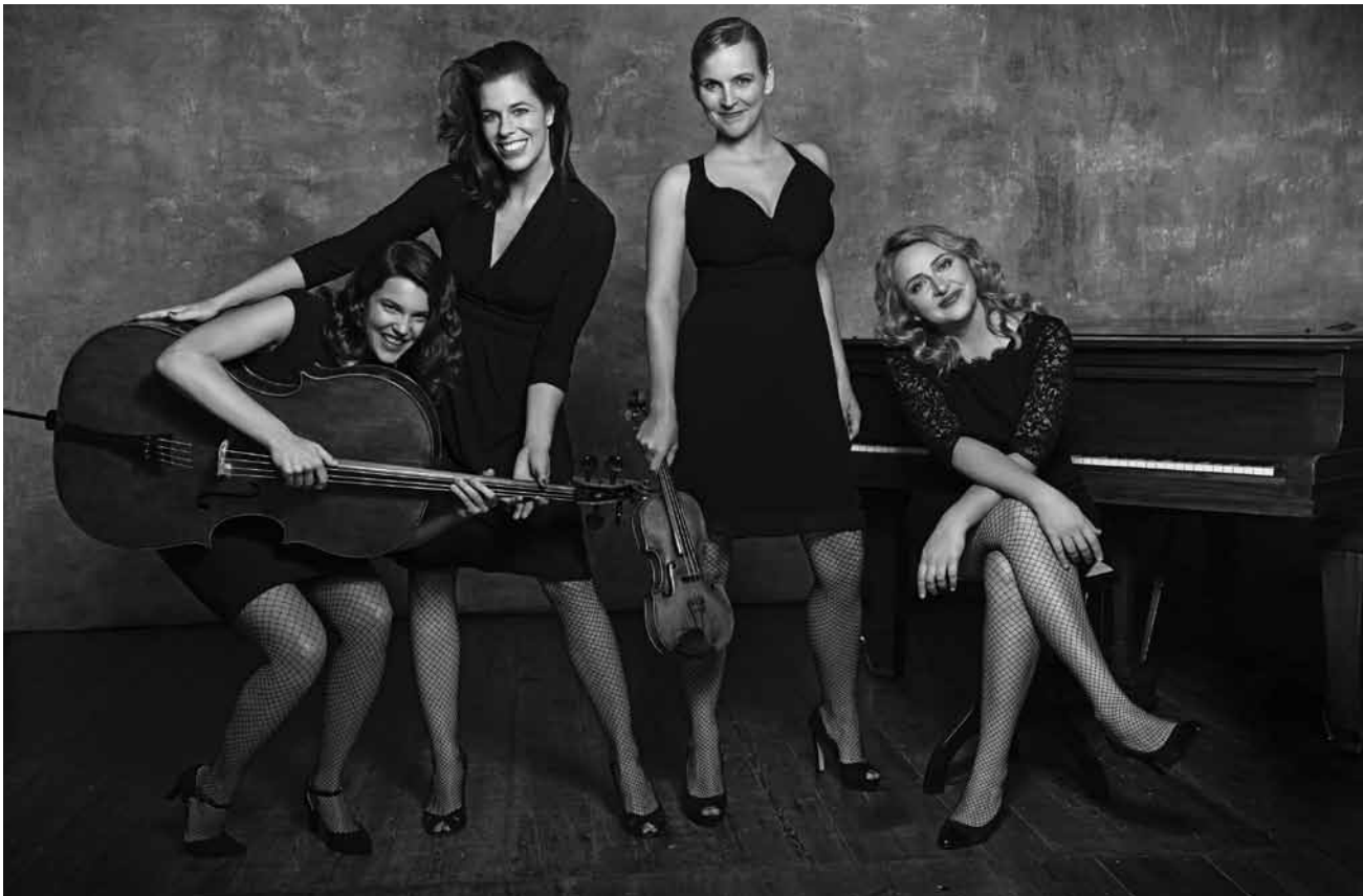
Im Cube 521 in Marnach gibt es am Samstag, dem 3. Oktober, ab 20h Musik von Salut Salon auf die Ohren.