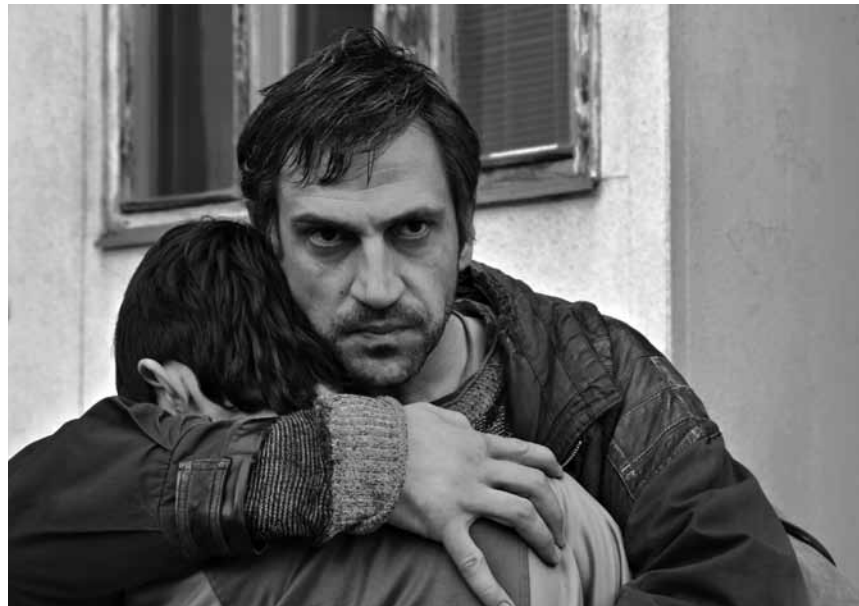
Le festival CinEast propose « Otac », le 11 octobre à 21h à la Cinémathèque : un drame familial de la pauvreté.

Gelsomina, jeune fille naïve et simple d'esprit, a été achetée par Zampanò, un homme brutal qui gagne sa vie en faisant des balades et en crachant du feu. Gelsomina, tout d'abord effrayée, va se mettre à aimer Zampanò d'un amour muet et total. Zampanò, animal fruste, ne voit rien.