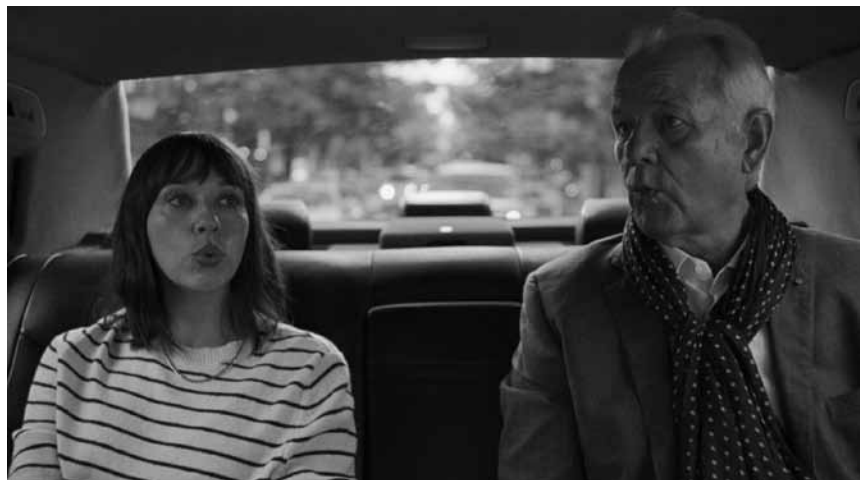
„On the Rocks“ ist kein Drink, sondern ein Film über eine besondere Tochter-Vater-Beziehung und läuft in fast allen Sälen.

Im London der 70er-Jahre ist es Sally leid, dass noch immer ein veraltetes Frauenbild propagandiert wird. Insbesondere der alljährliche „Miss World“-Wettbewerb ist ihr ein Dorn im Auge, weil dieser Wettstreit ihrer Meinung nach den Zustand nicht gerade verbessert. Kurzerhand plant sie mit ihrer besten Freundin Jo und weiteren Anhängerinnen des „Women's Liberation Movement“ eine Aktion, die die ganze Welt wachrütteln soll. Wie praktisch, dass die Misswahl dieses Jahr in London stattfindet und dabei 100 Millionen Zuschauer an den Fernsehgeräten auf der ganzen Welt erwartet werden.