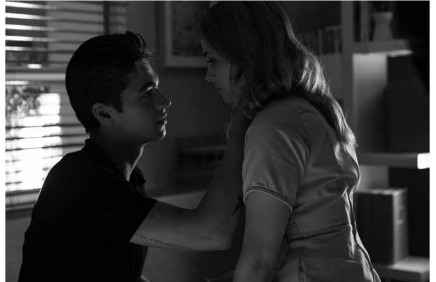
Ob das Bild vor oder nach dem Zusammenprall entstand? „After We Collide“ läuft im Kinopolis Belval und Kirchberg.