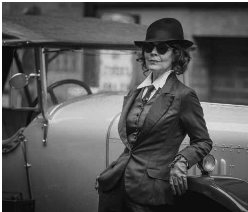
Tante Polly, un des principaux personnages et femme sûre de son flingue.