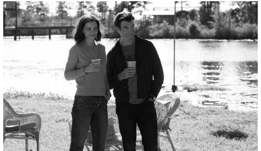
„The Secret: Dare to Dream“ oder wie das Leben aus den Fugen gerät und das Glück wiederkehrt – läuft im Kinepolis Kirchberg und Belval.