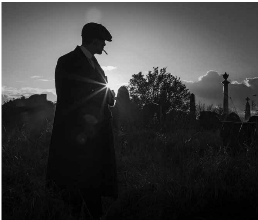
Souvent, dans « Peaky Blinders », les chemins mènent au cimetière.