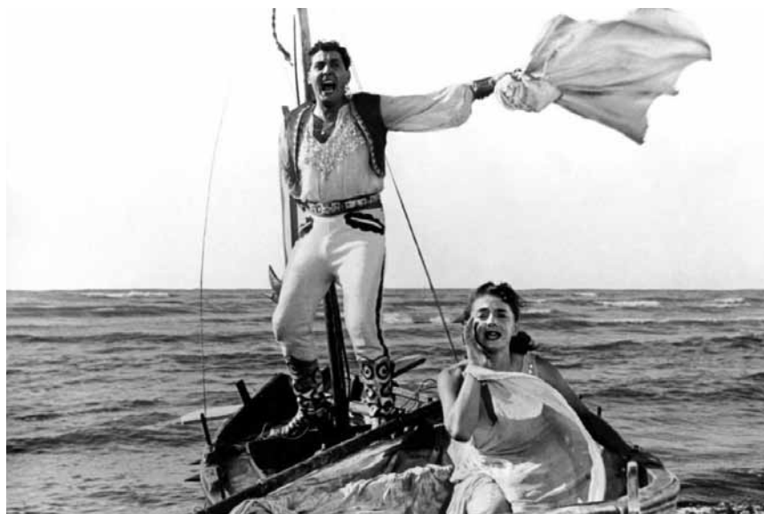
La Cinémathèque présente « Lo sceicco bianco », dans lequel une jeune femme est à la recherche d'un personnage de roman-photo - à voir le 5 octobre à 18h30.