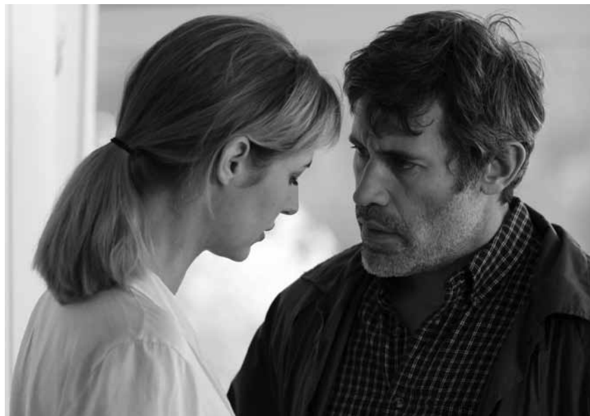
« L'enfant rêvé » parle du désir d'enfant couplé à l'adultère - nouveau à l'Utopia.

Max ist 9 Jahre alt und kann sein Glück kaum fassen, als er sein neues Zuhause kennenlernt: Die Burg Geroldseck ist zwar mittlerweile ein Altenheim, wo seine Mutter als Altenpflegerin arbeitet, doch das Gemäuer war mal eine echte Ritterburg. Max schließt schnell neue Freundschaft mit den Senioren Vera, Horst und Kilian von Tisch Nummer 7, die nicht umsonst „die wilde 7“ genannt werden, denn sie haben es immer noch drauf. Als auf Burg Geroldseck plötzlich Wertgegenstände verschwinden, macht das ungewöhnliche Quartett sich auf die Suche nach dem Dieb.