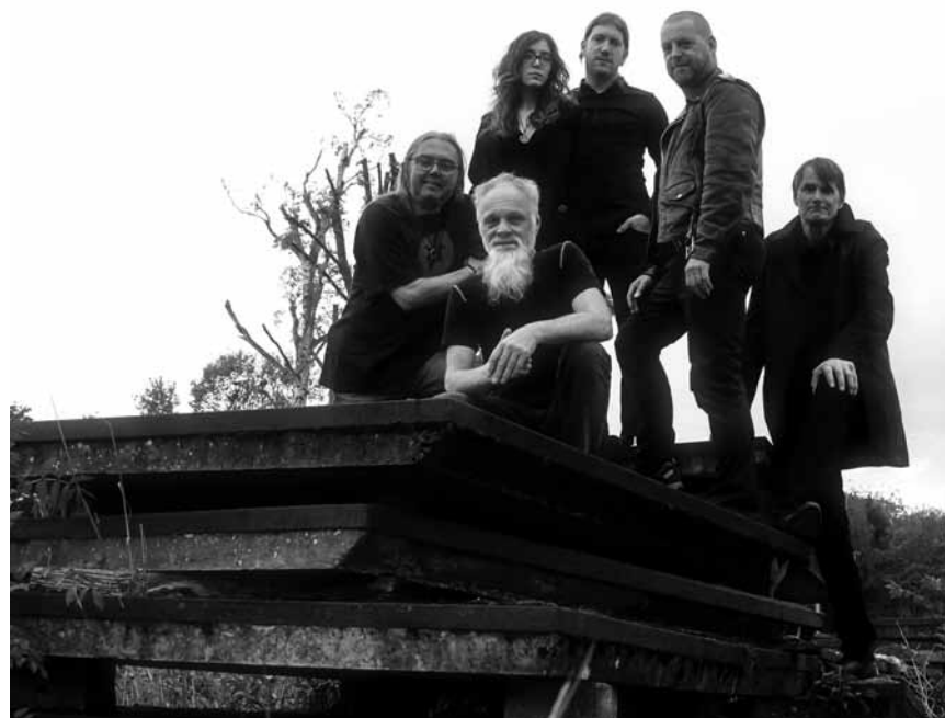
Heavy Petrol, die 2011 gegründete luxemburgische Bluesformation ist am 14. Oktober um 20 Uhr im Aalt Stadhaus zu Gast.