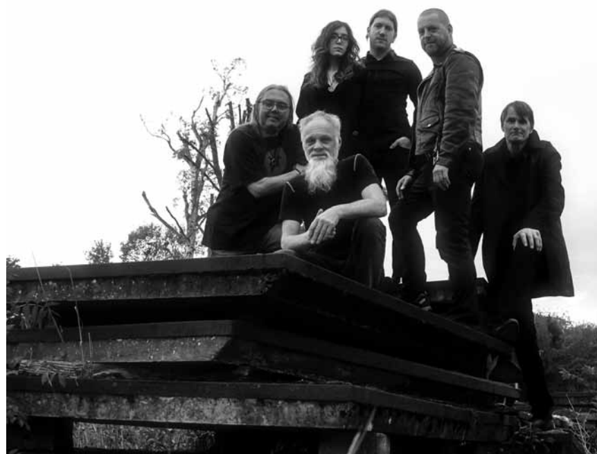
Heavy Petrol, die 2011 gegründete luxemburgische Bluesformation ist am 14. Oktober um 20 Uhr im Aalt Stadhaus zu Gast.