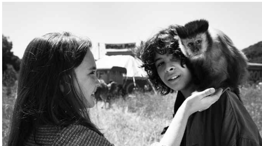
Un poney en danger : dans « Poly », deux amis essaient de sauver une vedette à quatre sabots. Aux Kinepolis Belval et Kirchberg.

Peter ist begeistert, dass sein Großvater nach dem Tod seiner Frau zu ihm und seiner Familie ziehen soll. Doch die Freude endet jäh, als dieser ihm sein Zimmer wegnimmt und Peter auf den unheimlichen Dachboden ziehen muss. So sehr er seinen