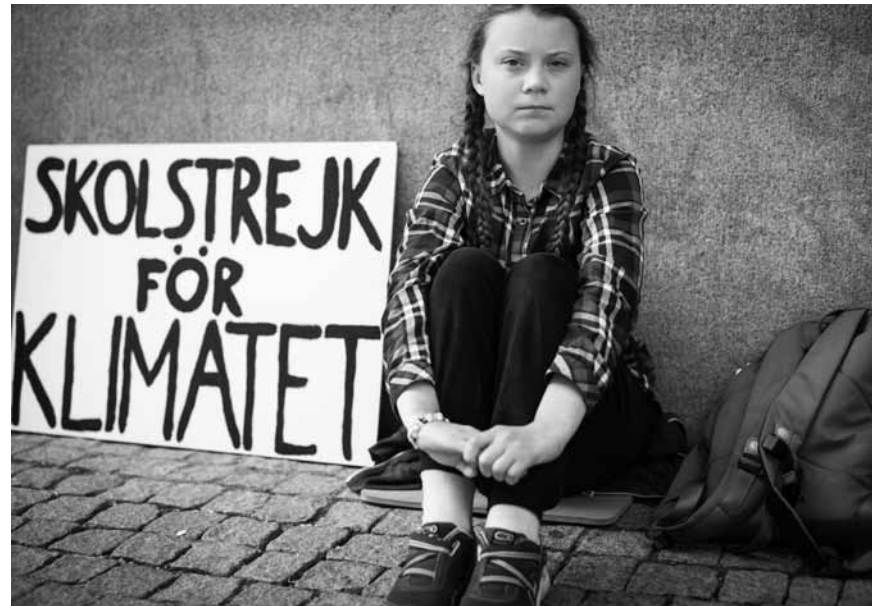
„I Am Greta“ ist ein Dokumentarfilm über die wohl bekannteste Jugendliche weltweit - zu sehen im Utopia.