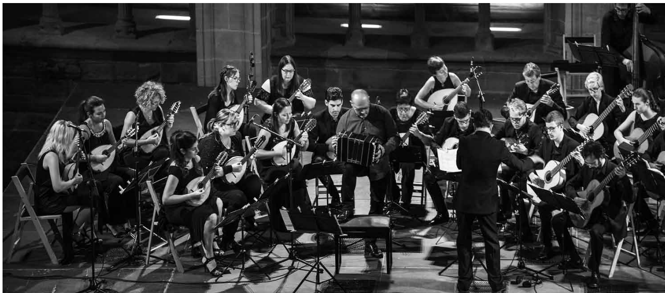
L'Ensemble à plectre municipal d'Esch-sur-Alzette fête son centenaire. Le concert de gala aura lieu ce samedi 24 octobre à 20h au Théâtre d'Esch.

The Luxembourg Story. More than 1.000 Years of Urban History, guided tour, Lëtzebuerg City Museum, Luxembourg, 15h (F). Tél. 47 96 45-00. www.citymuseum.lu