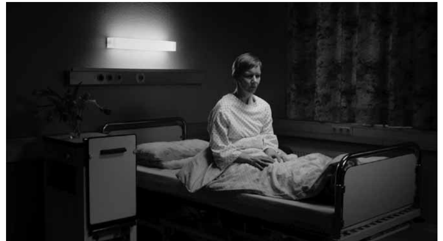
In „Schlaf“ treiben Alpträume eine Frau in den Wahnsinn und zum folgenreichen Nervenzusammenbruch - im Kulturhuf Kino, Scala, Sura und Orion.

Wiebke betreibt nicht nur einen eigenen Reiterhof, auf dem unter anderem Polizeipferde trainiert werden, sondern adoptierte mit Nicolina auch schon einmal ein osteuropäisches Mädchen - mit Erfolg. Ihr neuer Schützling, die fünfjährige Raya, macht es ihr da nicht ganz so einfach. Sie beschmiert das Bad mit Fäkalien, speißt tote Tiere auf und zwingt schwächere Kinder zu „Doktorspielen“. Und während selbst die Neurologen glauben, dass eine Besserung nur noch in einer spezialisierten Einrichtung erfolgen kann, will Wiebke nicht aufgeben - und greift zu immer extremeren Methoden.