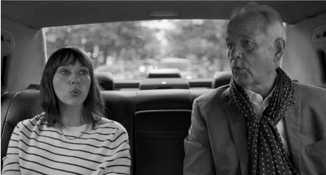
„On the Rocks“ schöpft das vermeintliche Konfliktpotenzial der Vater-Tochter-Beziehung zwischen Laura (Rashida Jones) und Felix (Bill Murray) nicht aus.