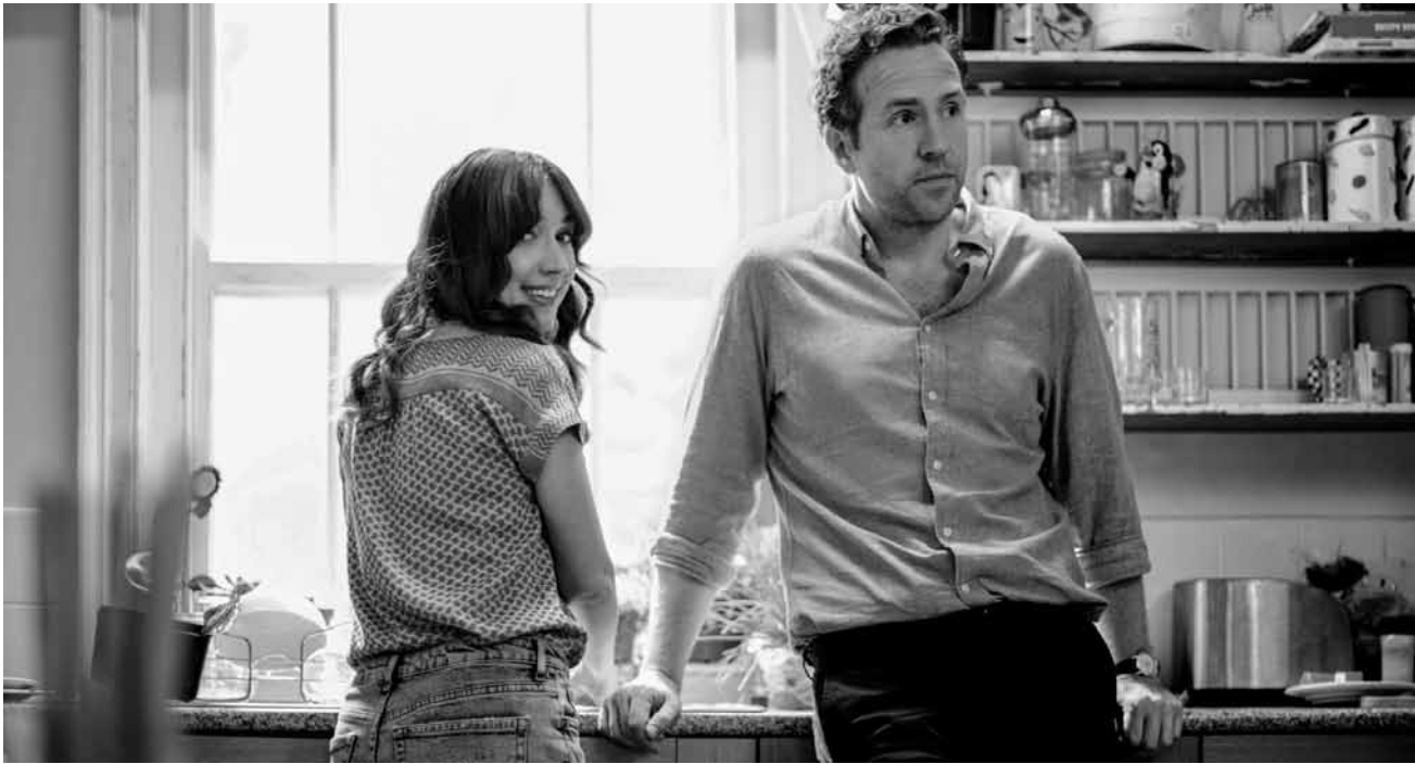
Esther Smith und Rafe Spall überzeugen in „Trying“ als adoptionswilliges Paar Nikki und Jason.