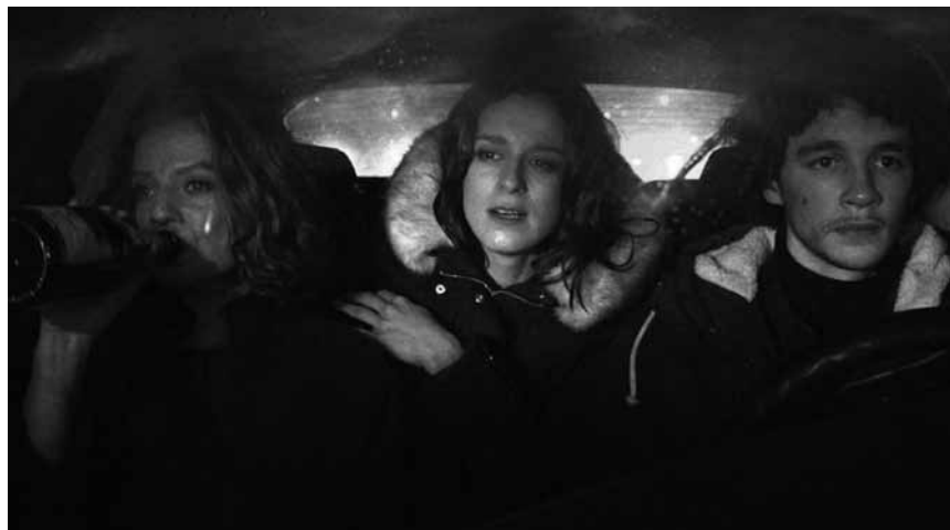
Dans « Amor amor », tout le monde tombe amoureux - mais de la bonne personne ? Marta, Jorge, Bruno, Lígia et Carlos se retrouvent dans un chaos émotionnel. À l'Utopia.

1863, États-Unis d'Amérique. Dans un convoi qui progresse vers l'ouest avec l'espoir d'une vie meilleure, le père de Martha Jane se blesse. C'est elle qui doit conduire le chariot familial et soigner les chevaux. L'apprentissage est rude, et pourtant Martha Jane ne s'est jamais sentie aussi libre. Et comme c'est plus pratique pour faire du cheval, elle n'hésite pas à enfiler un pantalon. C'est l'audace de trop