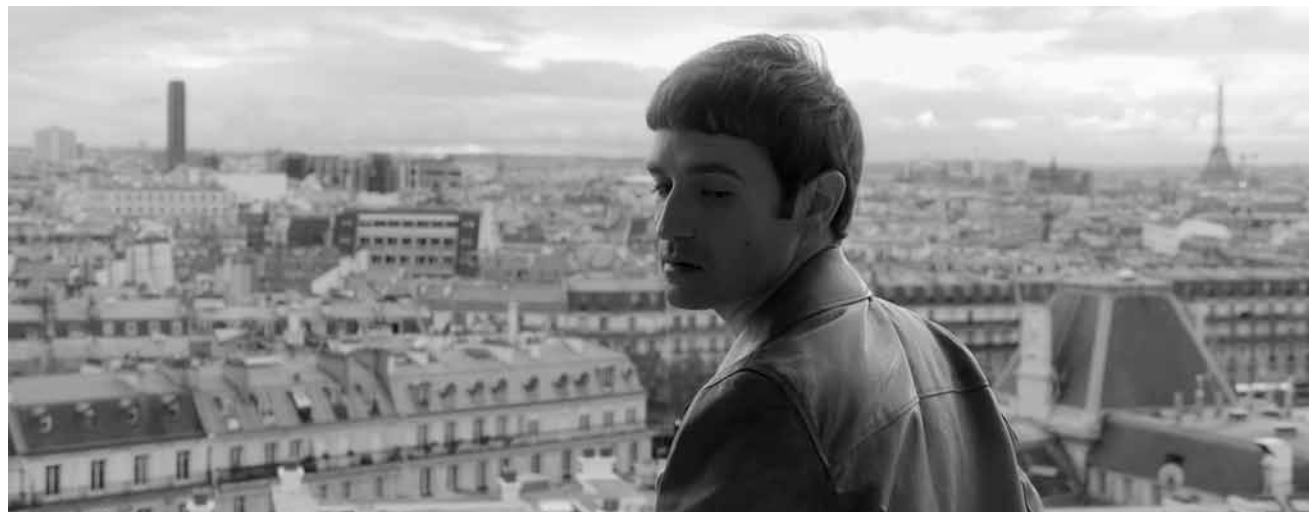
Dans « Garçon chiffon », Jérémie arrive difficilement à faire décoller sa carrière de comédien, sans parler de sa vie sentimentale. Il essaie de se ressourcer auprès de sa mère. À l'Utopia.

Des mois qu'Antoinette attend l'été et la promesse d'une semaine en amoureux avec son amant, Vladimir. Alors quand celui-ci annule leurs vacances pour partir marcher dans les