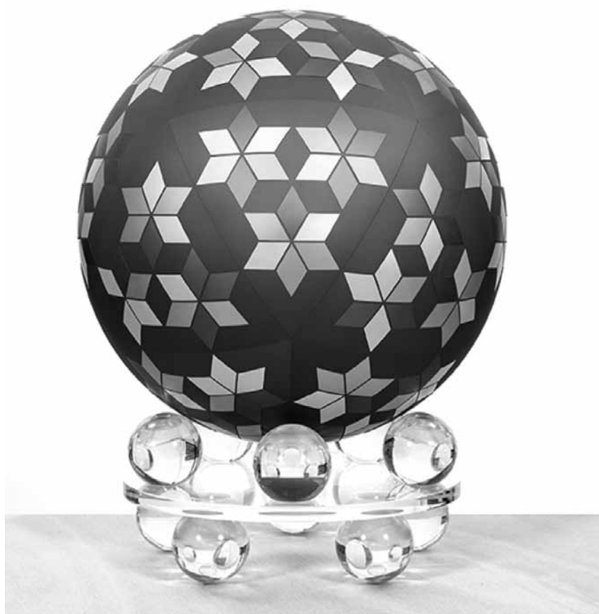
Les gravures et les sculptures de Jens W. Beyrich se composent de différents segments dont les couleurs diffèrent. On pourra les contempler dans « Hypersymmetrics », jusqu'au 16 janvier 2021 à la galerie Nosbaum Reding.

LAST CHANCE peintures, Cultureinside gallery (8, rue Notre-Dame. Tél. 26 20 09 60), jusqu'au 12.12, ve. 14h30 - 18h, sa. 11h - 17h30.