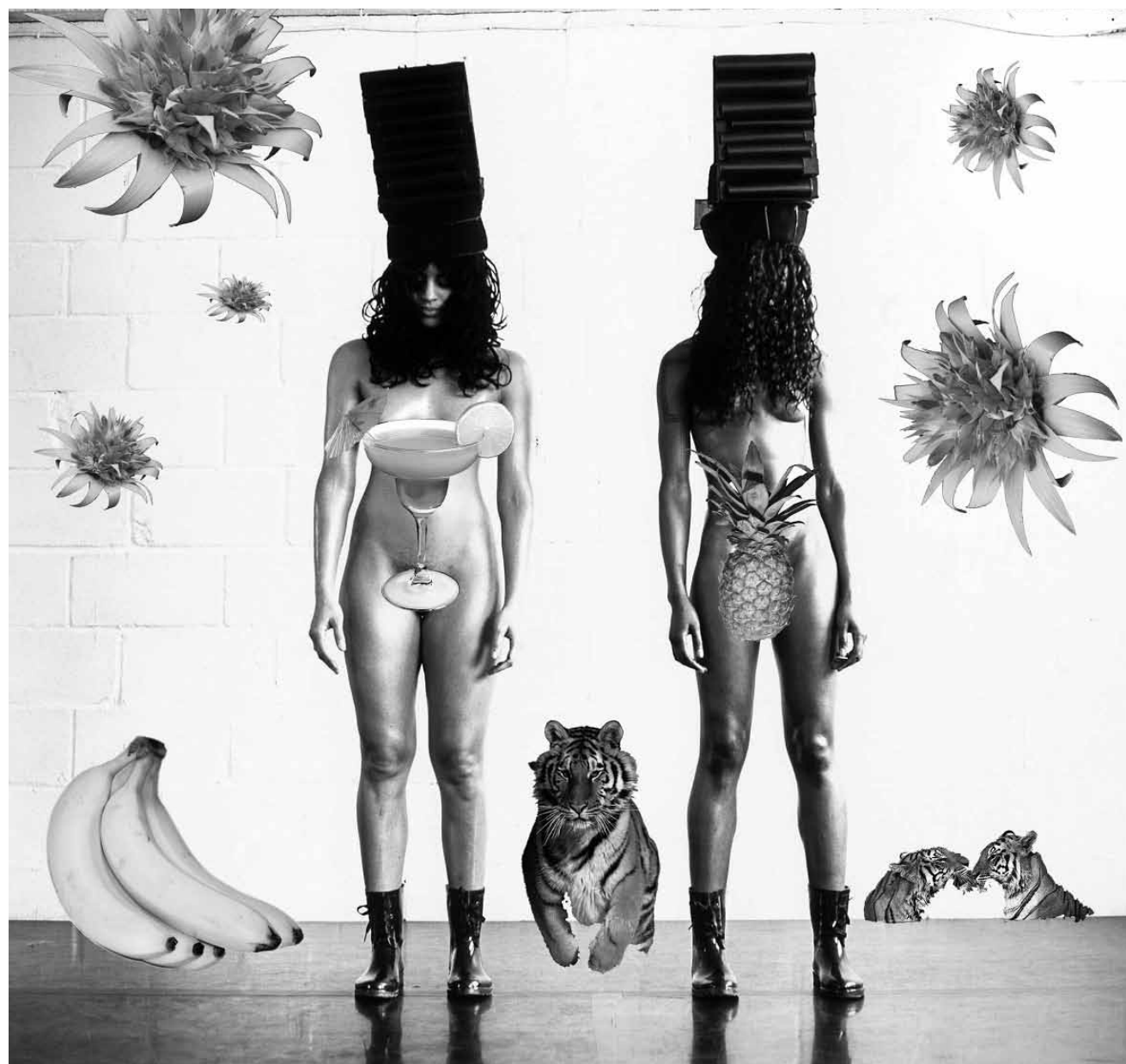
"Live Art and Feminism in the UK. How Do Women and Feminists Use Their Bodies to Make Art, and Why?" The Live Art Development Agency answers these questions online.

Ausstellungen über Mary Beth und Ciny Cherman, artsandculture.google.com/partner/ the-feminist-institute