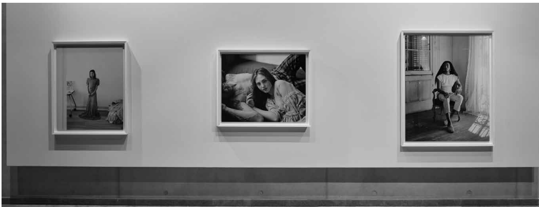
« I Know How Furiously Your Heart Is Beating » est une exposition des photographies d'Alec Soth. À voir chez Arendt & Medernach, jusqu'au 30 avril.

(38, av. Charlotte. Tél. 5 87 71-19 00), jusqu'au 13.3, lu. - ve. 10h - 18h, sa. 10h - 16h.