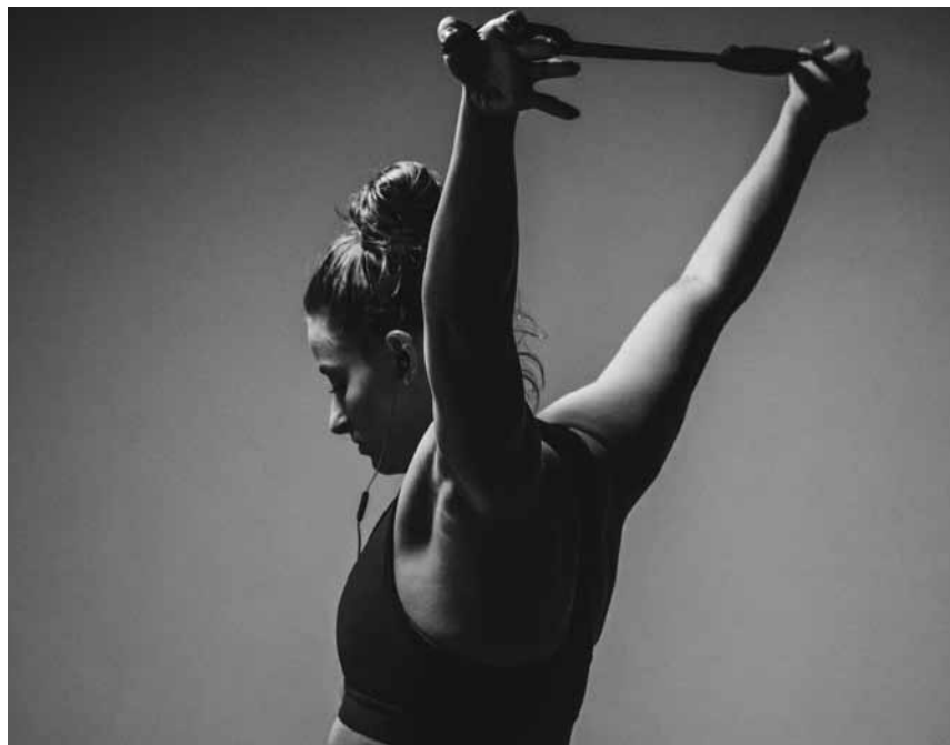
Dans « Nadia, Butterfly », une athlète professionnelle part en retraite à 23 ans après une jeunesse pleine de sacrifices. Au Kinepolis Kirchberg, ce dimanche 7 mars à 18h30.

L'été de ses 9 ans, Hugo passe les grandes vacances avec ses cousins chez sa mamie Sara. Quand ils apprennent que le loup va venir la chercher, les enfants se mobilisent pour sauver leur grand-mère et se lancent dans une aventure inoubliable.