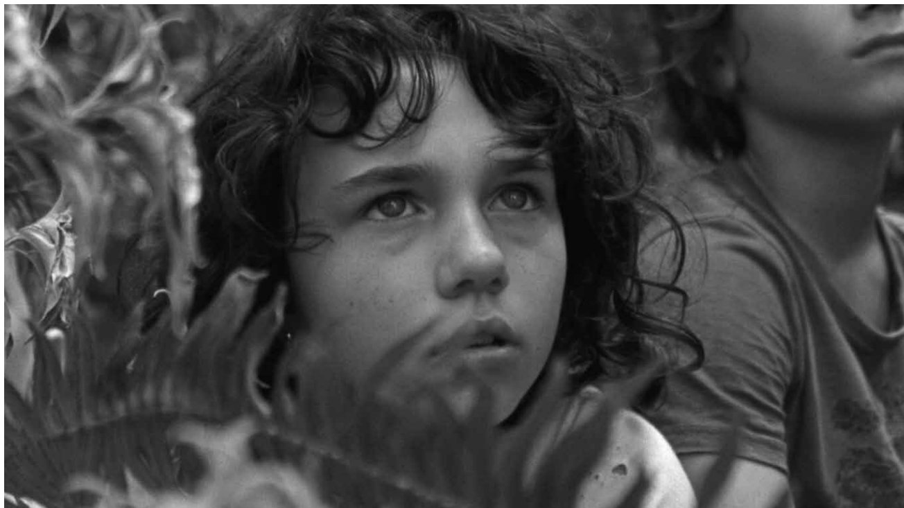
„Wendy“, die Neuerfilmung des Peter-Pan-Mythos läuft am 12. März um 19 Uhr im Kinopolis Kirchberg.

mit allen Mitteln, ihn zu überführen. Bei seinem gnadenlosen Feldzug gerät er mit seinem neuen Partner mehr und mehr in die Grauzone von Illegalität und Korruption.