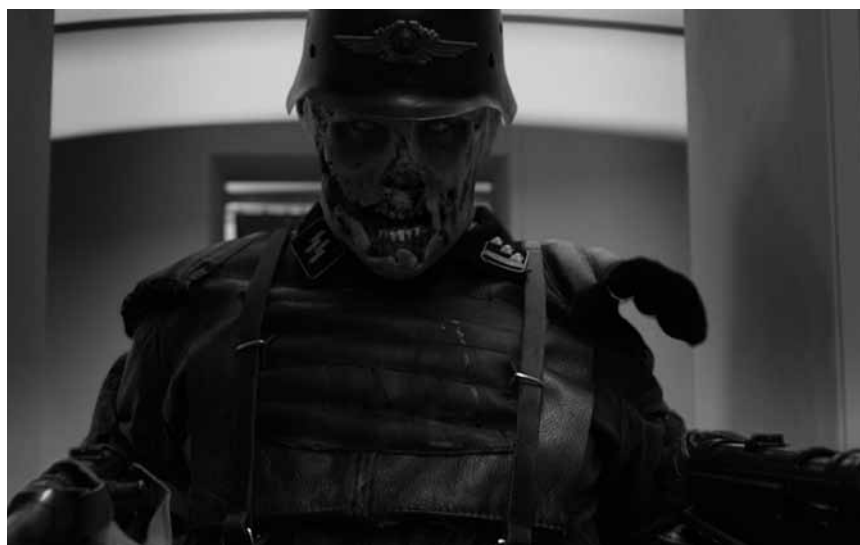
Fliegende Haie, angeführt von Nazi-Zombies : „Sky Sharks“ trifft wohl ganz den Geschmack von Trashfilmliebhaber*innen - neu in den Regionalkinos.

Maja und ihre Freundin haben nach dem Zweiten Weltkrieg Europa verlassen, um in Amerika ein neues Leben anzufangen. 15 Jahren später lebt sie mit ihrem Mann Lewis ein geruhiges Vorstadtleben. Doch der Pfiff eines Nachbarn bricht die Wunden der Vergangenheit wieder auf. Maja glaubt in dem Mann ihren Peiniger von damals zu erkennen. Also entführt sie ihn kurzerhand, um ihn für seine ungesühnten Verbrechen büßen zu lassen.