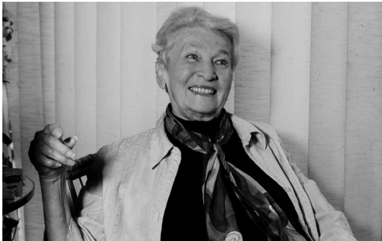
Elle est une des pionnières des musiques électronique et expérimentale : le programme instrumental « Occam Ocean » d'Éliane Radigue sera à l'honneur au Mudam, ce dimanche 7 mars à 14h30 et 16h30.

Foodsharing Distribution Day, club des jeunes, Beaufort, 18h. facebook.com/FoodsharingLuxembourg