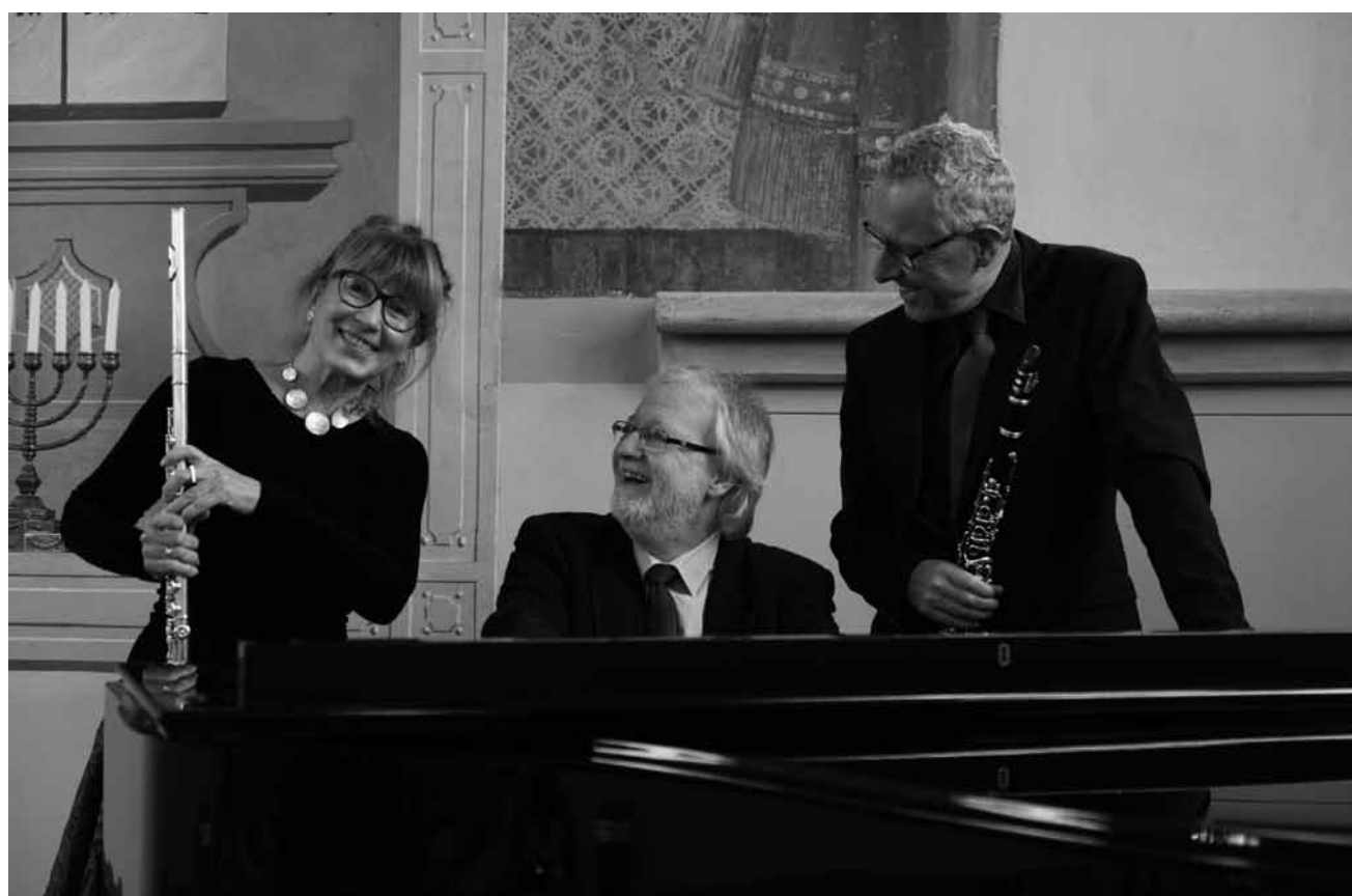
Im Rahmen des Weltfrauentags lädt der Trierer Zona-Club an diesem Sonntag, dem 7. März um 17 Uhr dieses Jahr mit dem UBI-Trio zu seinem traditionellen Benefizkonzert ein - die Live-Übertragung findet im Bürgerrundfunk OK54, sowie auf dessen Facebook-Kanal statt.

ONLINE Le temps suspendu , rencontre littéraire, 16h. Dans le cadre du 38e Festival des migrations, des cultures et de la citoyenneté, en collaboration avec les soirées Millefeuilles de la Maison des associations. Inscription obligatoire : clae.lu/festival/38e-festival-des-migrations-des-cultures-et-de-la-citoyennete-online