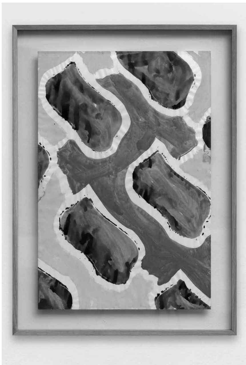
Claude Viallat « [d]ans tous les sens » : jusqu'au 20 mars, la galerie Ceysson & Bénétière présente les techniques mixtes de l'artiste contemporain.