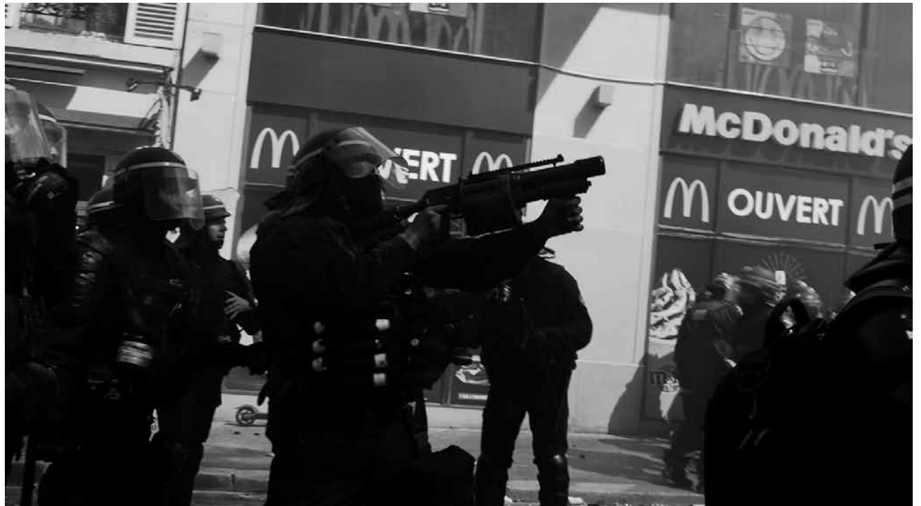
Le documentaire « Un pays qui se tient sage » de David Dufresne évoque le mouvement des Gilets jaunes. À l'Utopia.