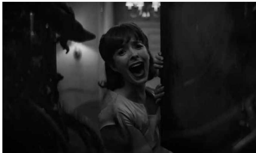
Jeder Tod hat eine Geschichte: Leichenbestatter Montgomery Dark erzählt in „The Mortuary Collection“ die grausamsten davon - neu in den Regionalkinos.

À un moment où toute nouvelle sortie cinématographique devient une bouffée d'air frais, les distributeurs jouent la carte du mélo sympathique. Heureusement, le talent de Gemma Arterton parvient à compenser quelque peu un parfum bien sucré et à peine acidulé. (ft)