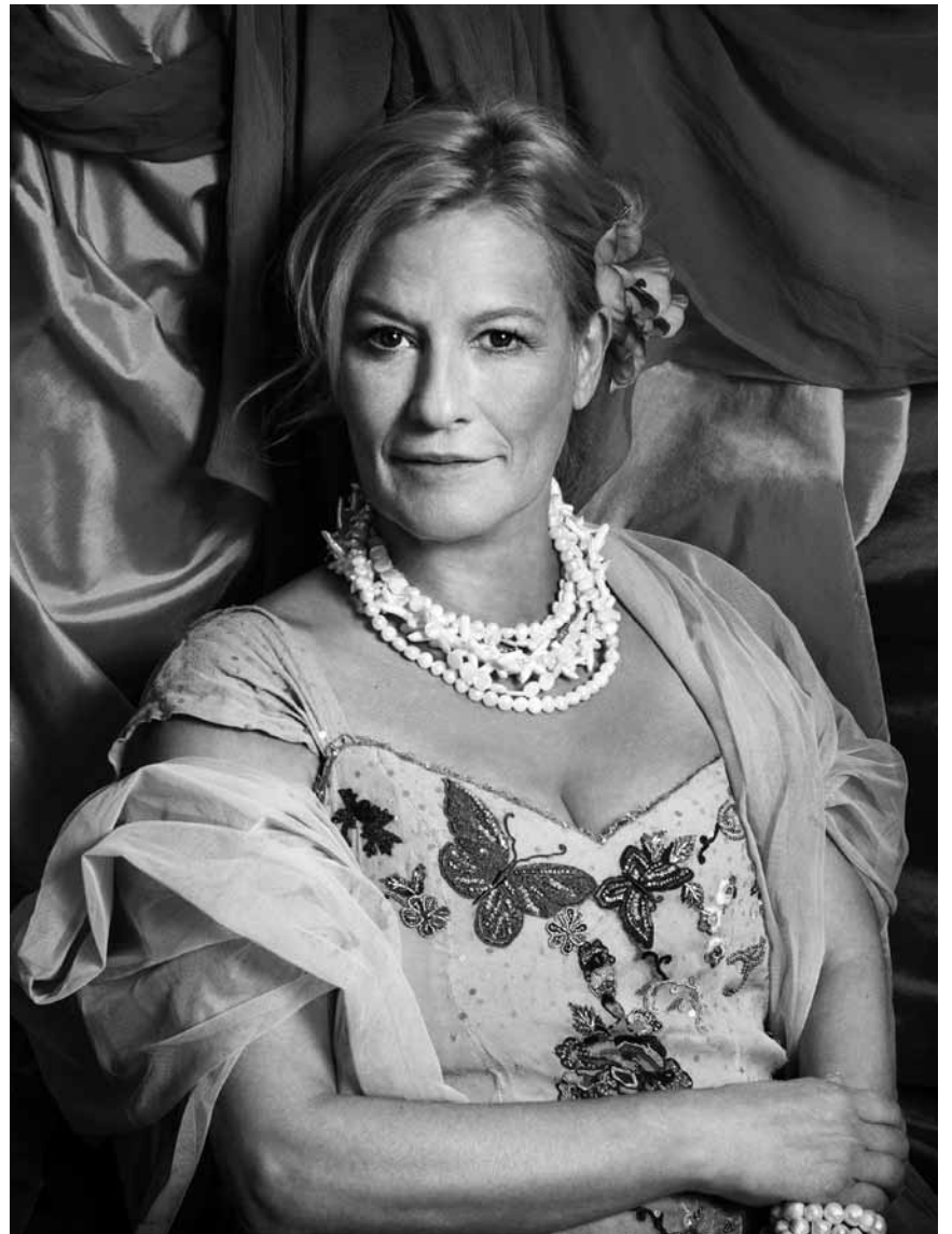
Suzanne von Borsody widmet sich in einem literarisch-musikalischen Bilderbuch dem Künstler Paul Gauguin – an diesem Freitag, dem 12. März um 20 Uhr im Cube 521.