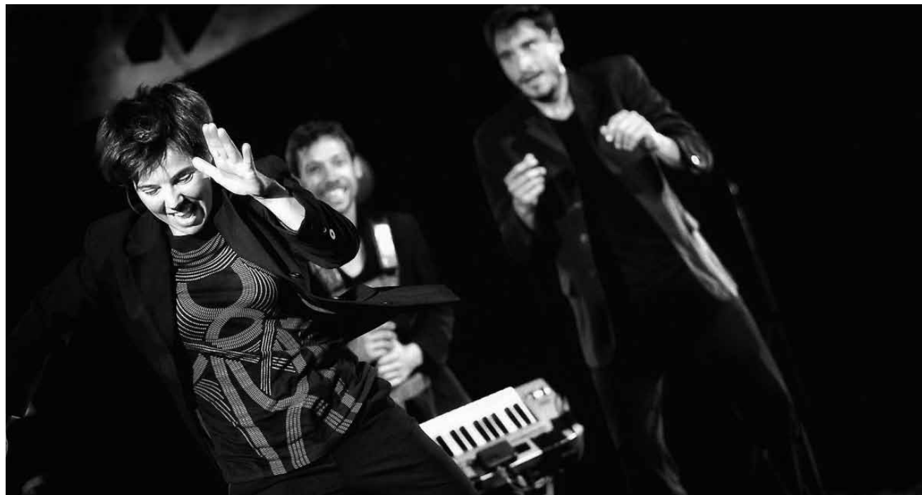
Soleo, ce sont trois artistes multi-instrumentistes et de la musique en mouvement. Au Centre des arts pluriels Ettelbruck, ce dimanche 14 mars à 11h.

Eedelsteng Seefen , Workshop (9-12 Joer), Musée national d'histoire et d'art, Luxembourg, 14h30. Tel. 47 93 30-1. www.mnha.lu Abschreibung erfuerderlech.