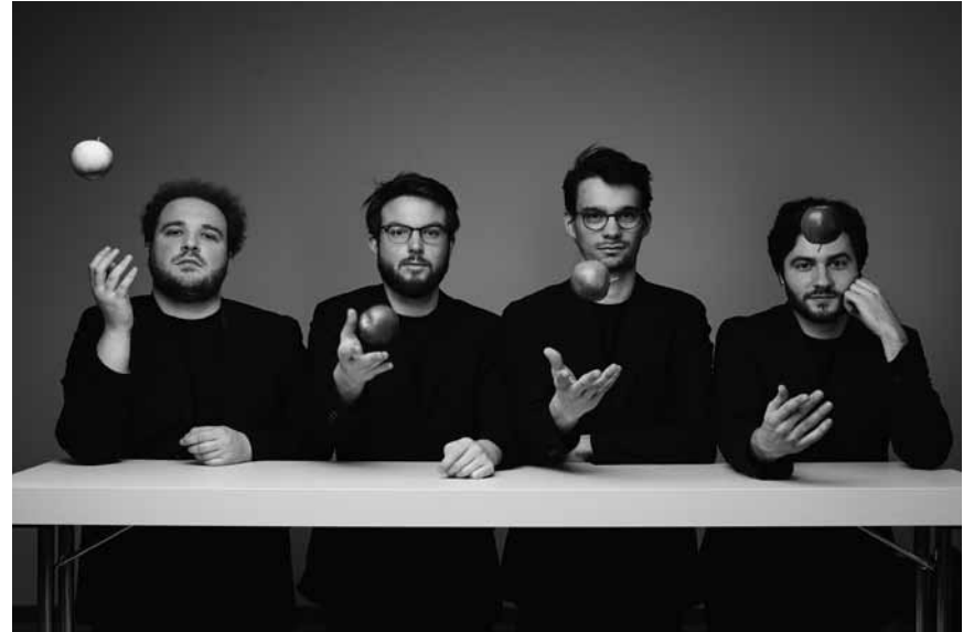
The Philharmonie invites the Goldmund Quartet for a « Face-à-face: Schubert's 'Death and the Maiden' ». On March 21st at 11 am.