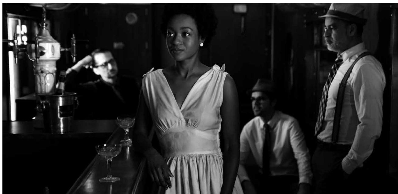
March Mallow est une formation de musicien-ne-s réuni-e-s par une envie de retrouver le son jazz des années 1950. Au Cape, ce vendredi 2 avril à 20h30.

3 du Trois , « Beat, I Just Wish to Feel You » du collectif Dope et Jenna