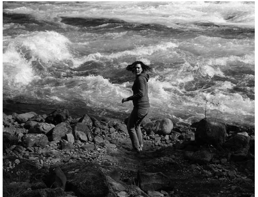
Jessicas Rückzug in die Wildnis wird jäh von einem Psychopathen unterbrochen: „Alone“ – neu im Kursaal und Waasserhaus.