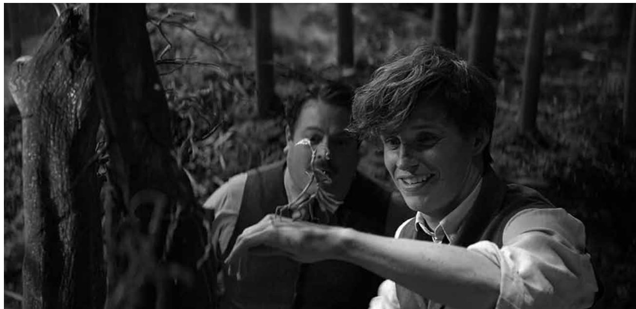
Der Magiezoologe Newt Scamander zieht die Zuschauer*innen mit seinen fantastischen Tierwesen in die Zauberwelt der J. K. Rowling: „Fantastic Beasts and Where to Find Them“ und „Fantastic Beasts: The Crimes of Grindelwald“ im Kinepolis Kirchberg.

Gellert Grindelwald, für dessen Verhaftung Newt Scamander gesorgt hatte, ist die Flucht gelungen. Und nicht nur das: Der Schurke hat