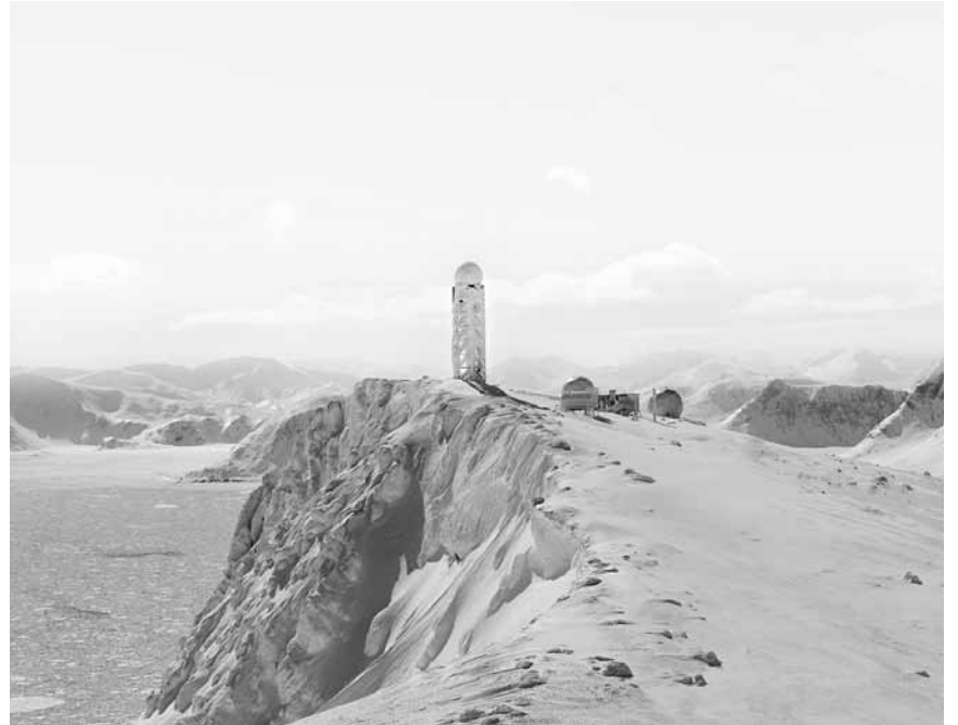
Le photographe Donovan Wylie a documenté depuis un hélicoptère le « North Warning System », un système de radars mis en place par les États-Unis et le Canada. À voir au jardin de Lélise, à Clervaux, jusqu'au 8 avril 2022.