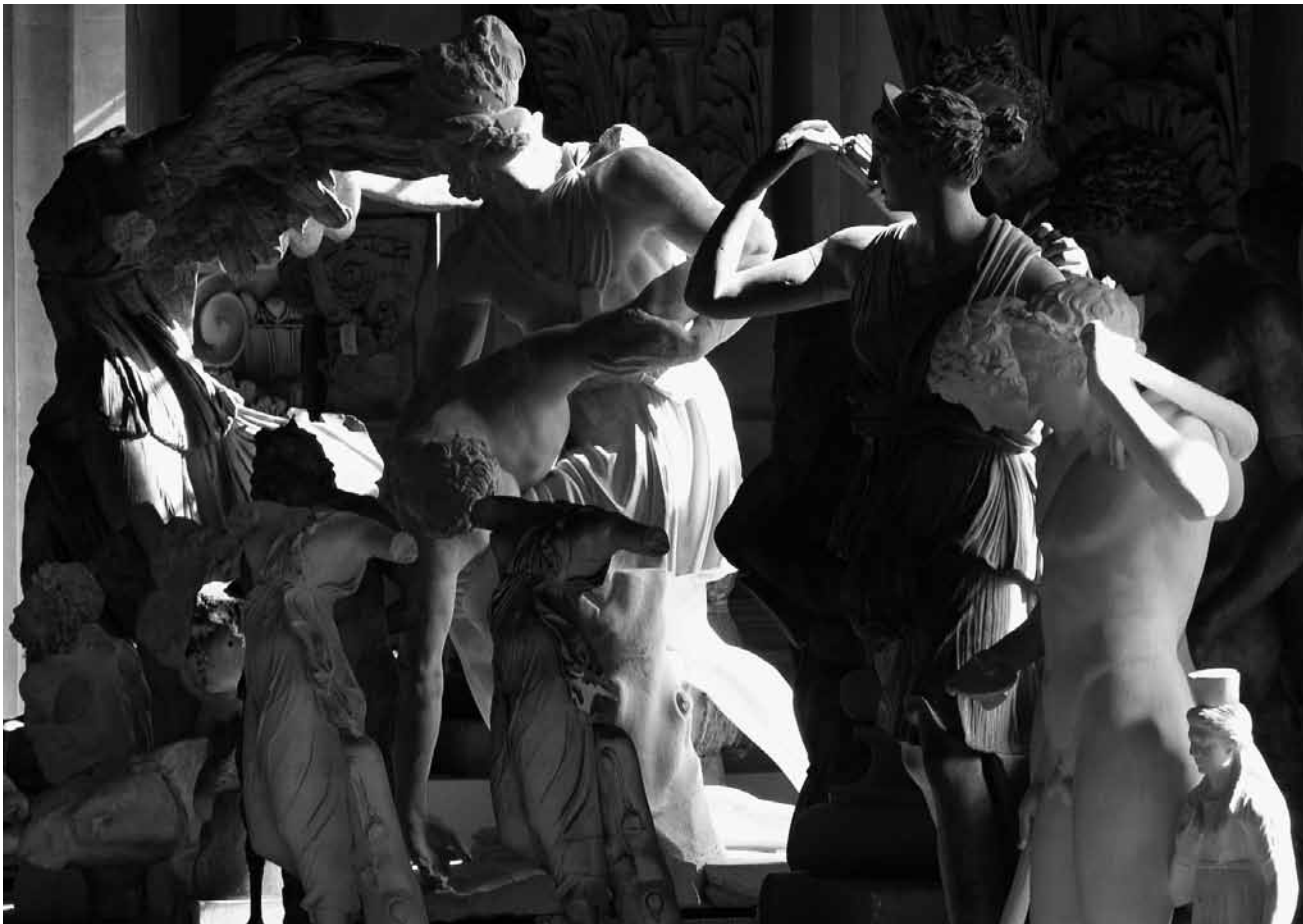
Sous le titre « Exposure : Dusk », la galerie Ceysson & Bénétière montre des vidéos de l'artiste Marie Josée Burki jusqu'au 30 juillet.