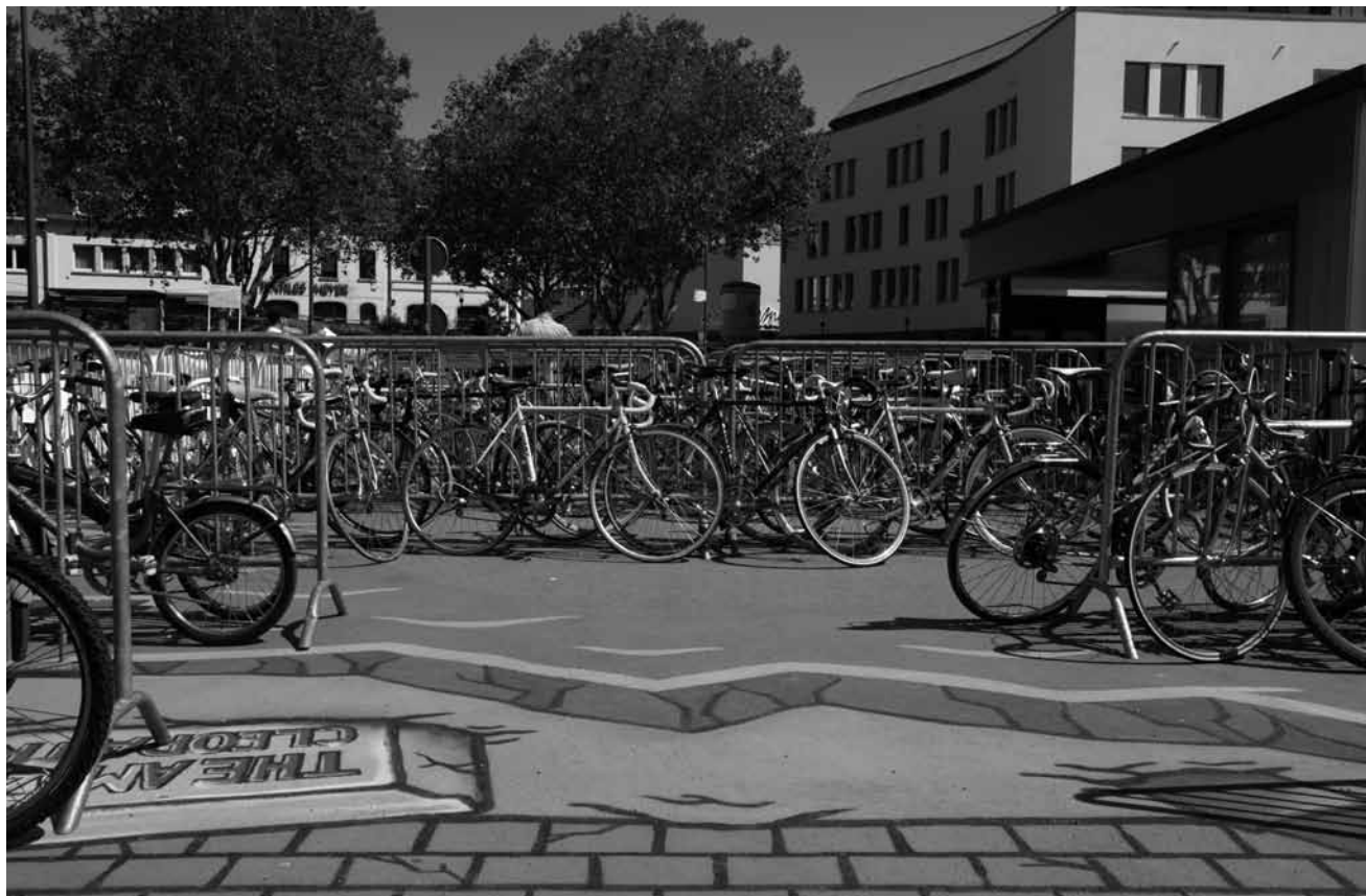
The Rotondes drive on two wheels - at least this Friday, July 9th, and this Saturday, July 10th, during the second-hand bike market We Ride. On Friday bikes can be bought from 4 pm to 10 pm, whereas on Saturday the market is open from 10 am to 6 pm.

Ecological Anxiety Disorder , avec la cie Eddi van Tsui, Artikuss, Soleuvre , 20h. Tél. 59 06 40. www.artikuss.lu woxx.eu/ead