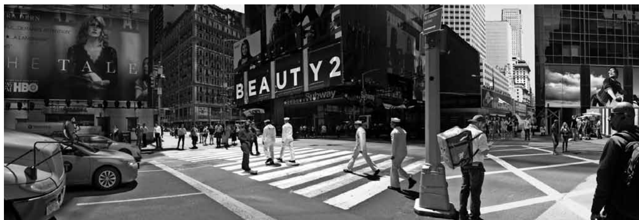
Mona Breede beleuchtet mit ihren Fotografien in „Urban Stories“ die Beziehungen zwischen Mensch und städtischem Raum. Bis zum 28. November in der Städtischen Galerie Neunkirchen.

der Rathauszyklus und unser Bild vom Krieg 1970/71, Historisches Museum Saar (Schlossplatz 15). Tel. 0049 681 5 06 45 01),