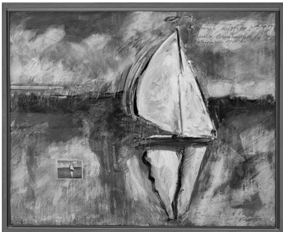
« Hommage à Joseph Kutter », 1997.