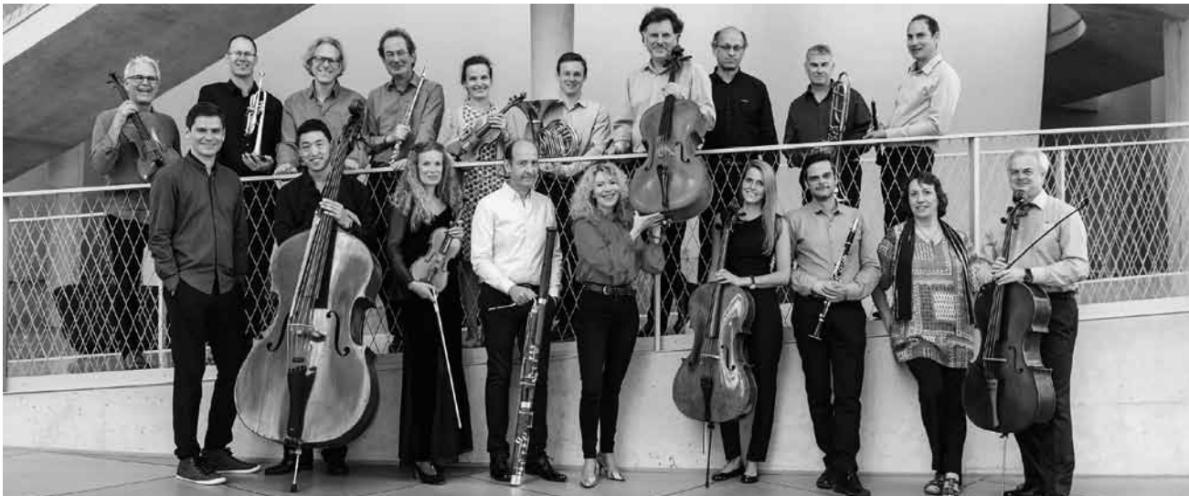
Le Cube 251 à Marnach invite la Kammerata Luxembourg, le 26 septembre à 17h - au programme : Rabl, Brahms et Chostakovitch.