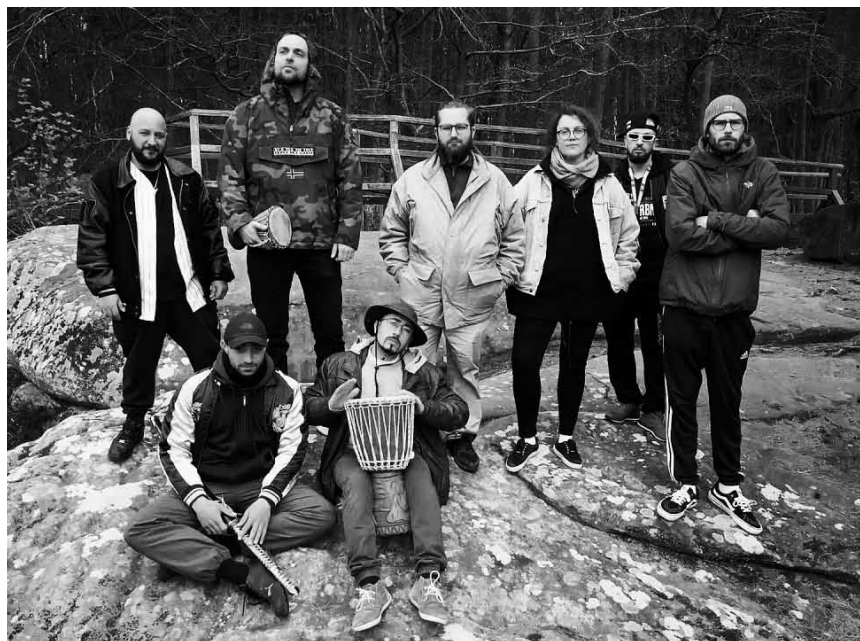
Oubliez la Kelly Family, voici le groupe hip-hop Pachamama Family ! À la Kulturfabrik, le 25 septembre à 20h30.