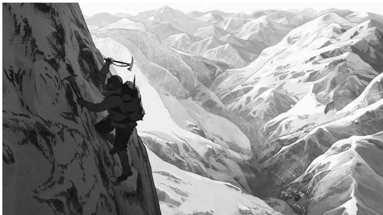
Für die Protagonisten von „Le sommet des dieux“ ist keine Bergwand zu steil.

Le petit village de Villar del Rio s'apprête à accueillir une délégation du plan Marshall. Pour recevoir dignement les bienfaiteurs américains,