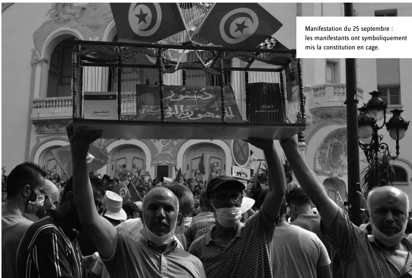
Manifestation du 25 septembre : les manifestants ont symboliquement mis la constitution en cage.